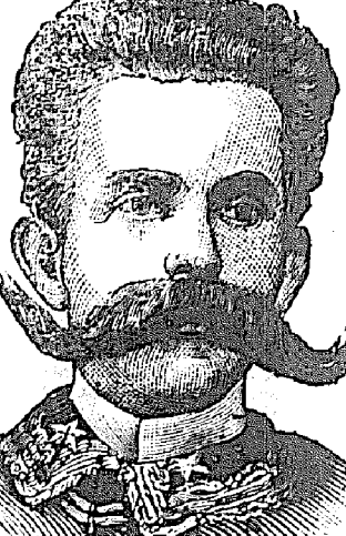
LE ROI HUMBERT.

PHIX DE L'ABONNEMENT. Edition Hebdomadaire. Un An, 6 Mois, 3 Mois. POUR LES ETATS-UNIS, $3.00 $1.50 $1.00 75 cts