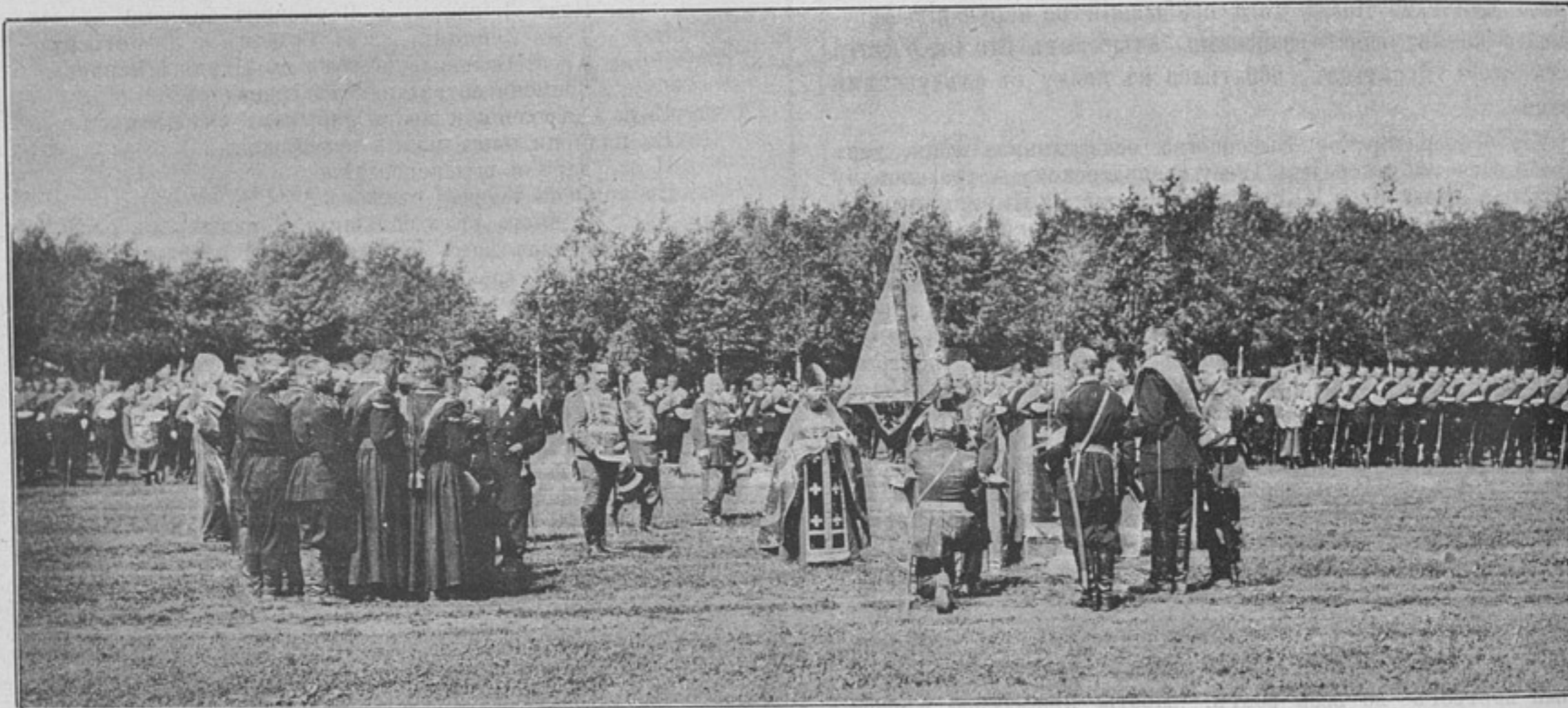
Къ статьѣ «200-лѣтній юбилей Астраханскаго полка».

собственной своей мобилизаціи, офицеръ располагаетъ лишь самымъ ограниченнымъ временемъ. Между тѣмъ большинство офицеровъ, въ особенности молодые, являются въ этомъ отношеніи крайне неопытными и совершенно неподготовленными; послѣдствія вскорѣ обнаруживаются: офицеръ взялъ въ походъ разныя ненужныя вещи, а существенныя не захватилъ,—ошибка впослѣдствіи трудно поправимая. Маневренная практика мирнаго времени даетъ въ этомъ отношеніи слишкомъ недостаточныя указанія, и офицеръ часто даже не знаетъ, какое количество вещей (вѣсомъ) онъ имѣетъ право взять въ походъ и какъ ихъ распределить, согласуясь съ установленной укладкой обоза.