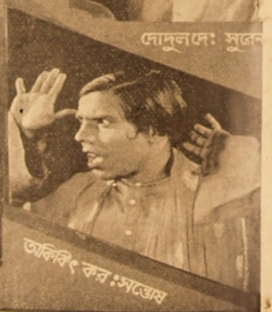
তালিবিং কর: সন্তোষ

মোদাকথা জানা গেল যে, পাত্রী টুনিদি'র ভগ্নী পদ্মমধু—তবে বিয়ে হবে 'কোর্টশিপ' কোরে নয়—'হাই-কোর্টশিপ' কোরে 'ম্যাটি, মোনিয়াল, আর 'লীগ্যাল' এই ছ' রকম অভিজ্ঞতা থাকতে কেষ্ঠ ব্রজেনবাবুকেই এই হাইকোর্টের বিচারপতি মনোনীত কোরলেন। এই জজের হাতে লাঞ্ছনা এবং