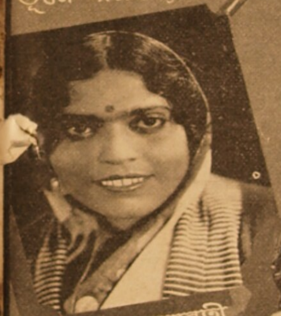
বিদ্যুৎলতা - পদ্মাবতী