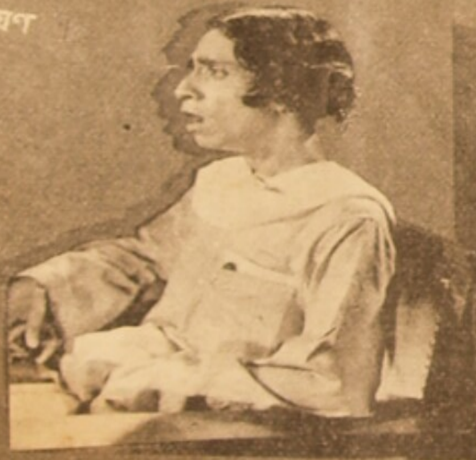
পেলব ঝায়: সত্যব্রত