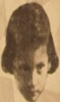
খুশি আশ্রমী সেন