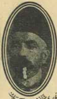
پند و اندرز حضرت امام

۱ فورقا ، سوغند بر شفق کرده بوزن آل سانجان ، سوزن بر در بملک آستند ، توتن اک صولک او جانان . او بنم ملخک بیلد بیدر ، بار دیا جانان ؛ او بنم ملخک ، آتجان .