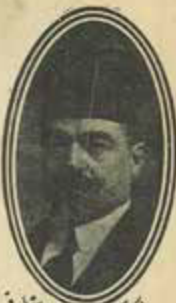
پند و اندرز حضرت امام