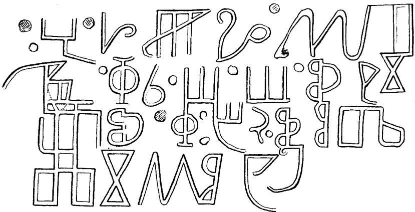
4. V. Nadpis Osorski.