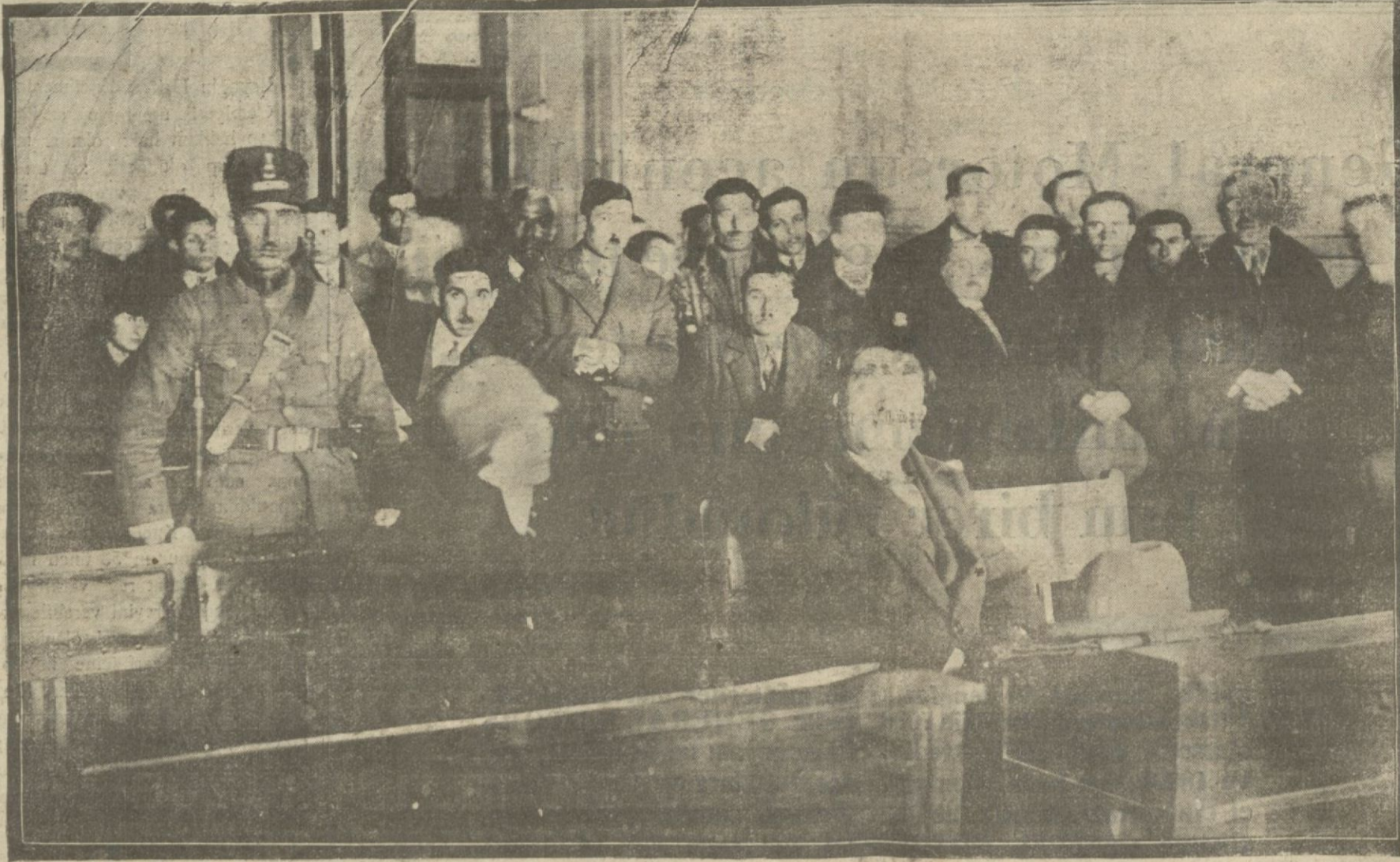
Hurunka gazetesinde Türklüğü hakaret neşriyatından dolayı Keleşoğlunun manakemesine Büyükmillet meclisinden verilen emir üzerine dün birinci cezada başlanmıştır.

MAHALLİ İMALİ PERTEV FABRİKASI Sıbul-Çenberlitaz