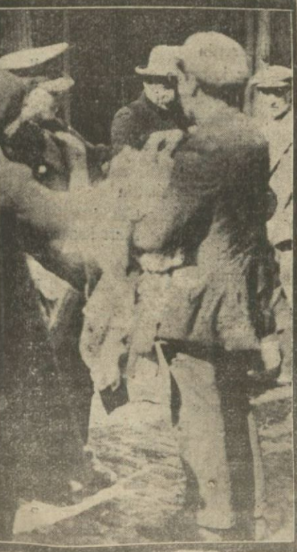
Bayram yaklaşınca her tarafta alış, veriş başladı.