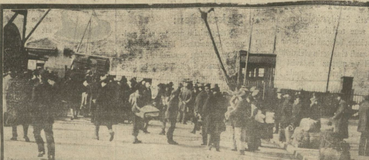
Bayram münasibetle Ankara ve anadolunun muhtelif yerlerinden şehrimize bir çok zevat gelmektedir.