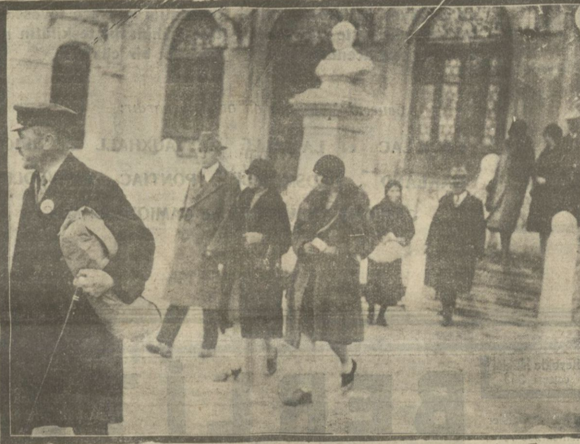
Evvelki gün ve dün Niyork, Şikotlan, Tever Seyyah vapurlarile şehrimize gelen Seyyahlar şehrin muhtelif yerlerini dolaşmışlardır. Amerikan Seyyaların Topanede Türk matalarının teşhir olunduğu Salonu ziyaretleri.