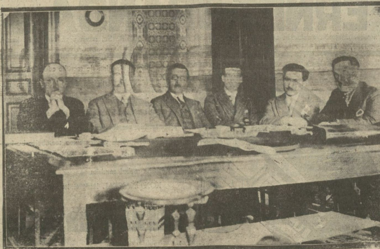
Darülfunun ilmi istilâhlar encümeni dün toplanarak faaliyetlerine devam etmişlerdir.