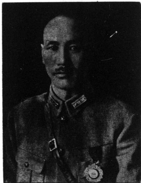
會 長 玉 照