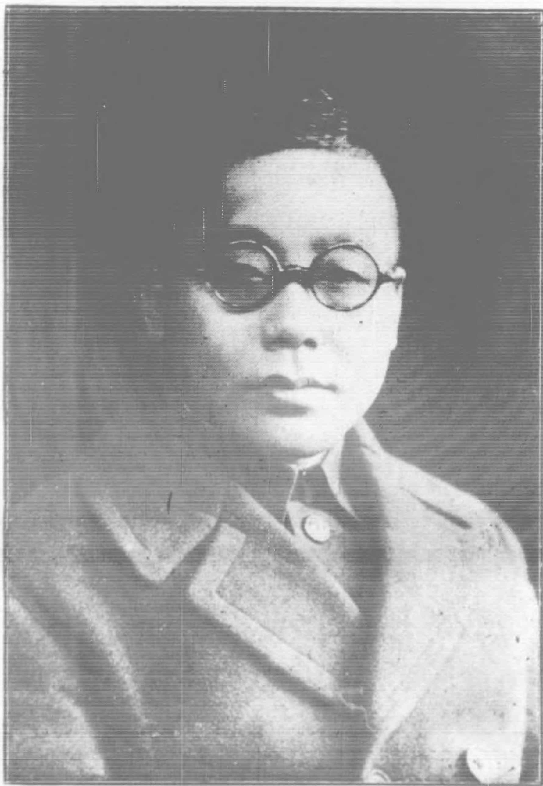
安 徽 省 政 府 代 理 主 席 吳 亞 醒 肖 像