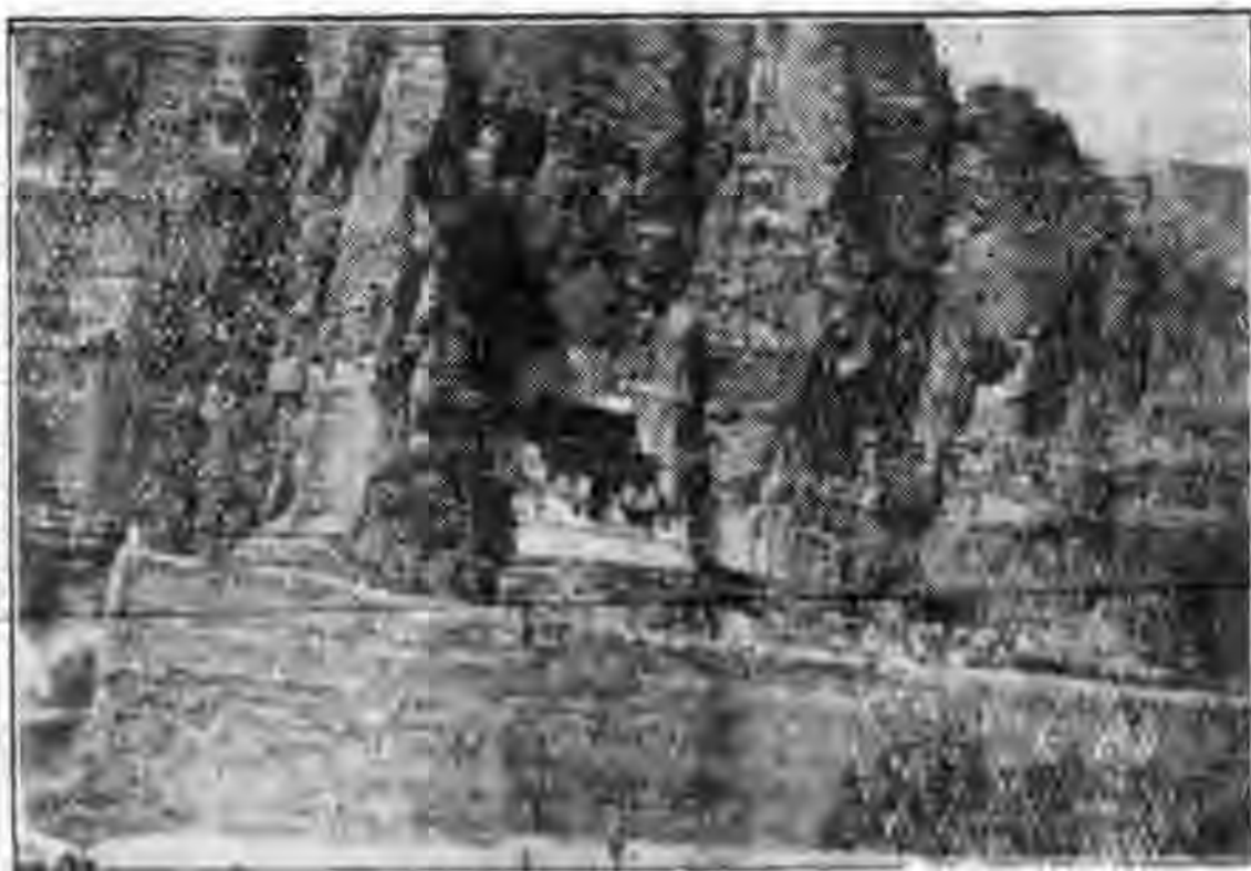
白馬寺寺在峭壁之上工人不為力

湟水為青海著名河流之一，其兩岸皆為高山，河中礁石頗多，水流急處，隱若聞雷，據礦學家黃伯達先生告我云，兩旁山石，為火層岩，必多金礦，附近如楊家店子，孫氏溝莊等處，本有土人，聚沙淘金，近年則因軍隊霸佔，小民不思染指矣。