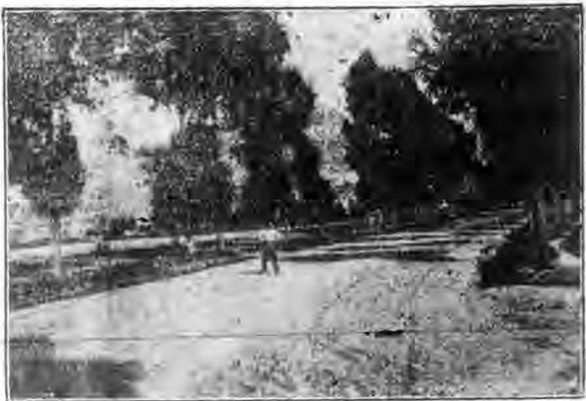
涇川大道為甘陝分界處

旅行家每以春秋為佳季，實則遠足旅行應以夏日為最宜，而尤以夏晨為最樂，余等此次乘驟入青，無日不以四句半五句鐘起身，蹄聲得得，楊柳依依，仰望長空如碧，曉風送客，神情為之一爽，及至紅日初升，霞光萬道，其美感實非筆墨所能形容，事後思之，猶有回味。