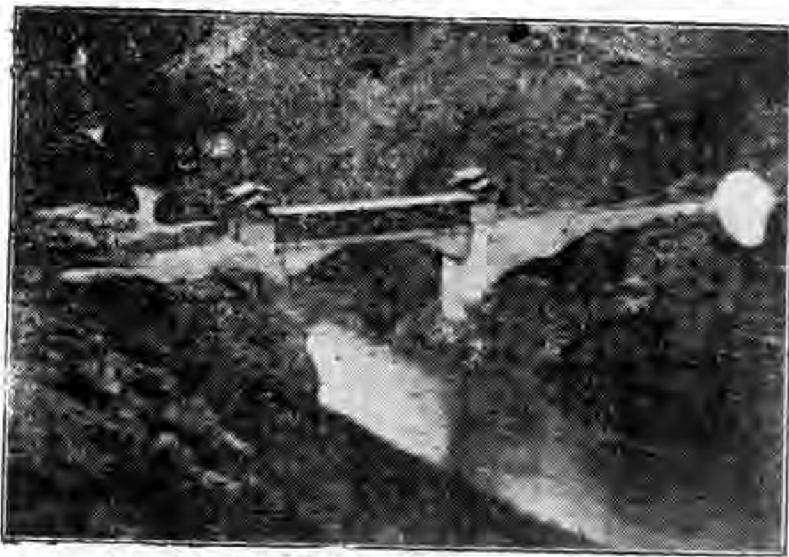
享堂橋位於甘青交界處爲入青要道