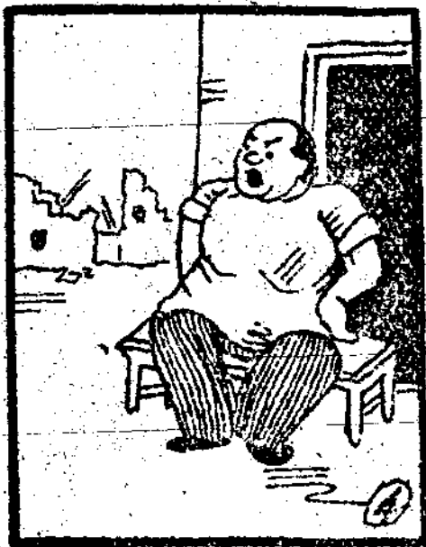
◎王大娘悲痛氣極了，天天藏着雪亮的菜刀，坐在門口外等待着復仇。