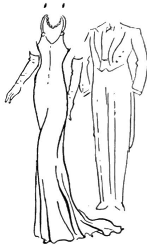
GALAKLÄNNING (TILL FRACK.)