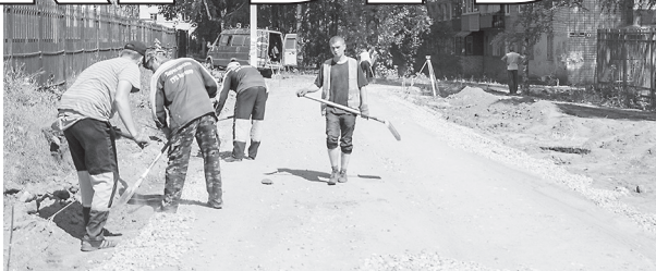
Ввиду множества крутых поворотов, общей сложности рельефа и плотности окружающей застройки многие работы приходится вести вручную

Конечно, жителям приходится терпеть определенные неудобства, как, впрочем, и при любом ремонте. Но абсолютное большинство понимают, что в конечном итоге еще один уголок Переславля станет красивей и удобней для проживания.