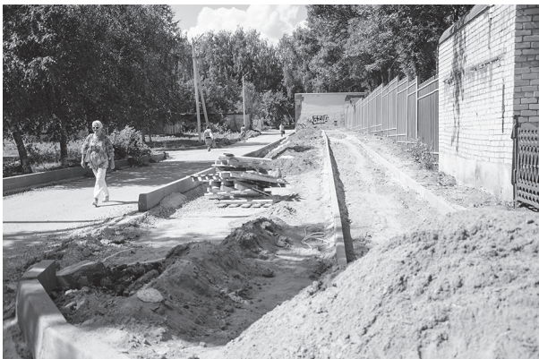
Ремонтируется не только проезжая часть, но и строятся новые удобные тротуары с бордюрами!