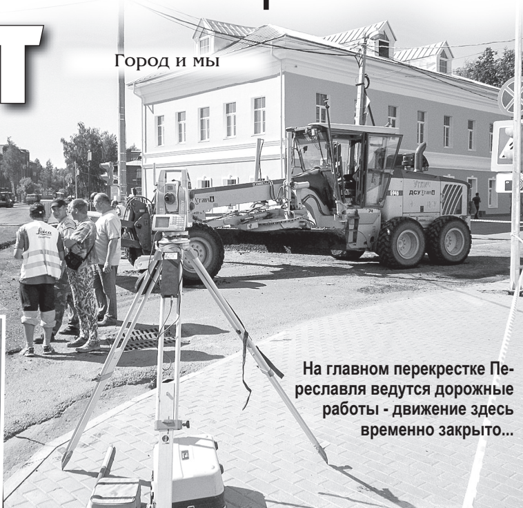
Город и мы