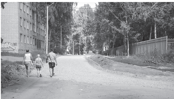
Проезд между межшкольным стадионом и домом № 12 на улице 50 лет комсомола скоро покроется новым асфальтом. Неужели многолетние огромные лужи навсегда уйдут в прошлое?!