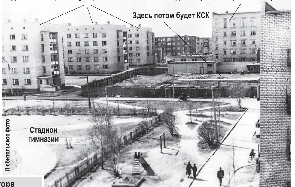
Дома №№ 12, 10 и 8 улицы 50 лет комсомола Здание треста «Переславльстрой»