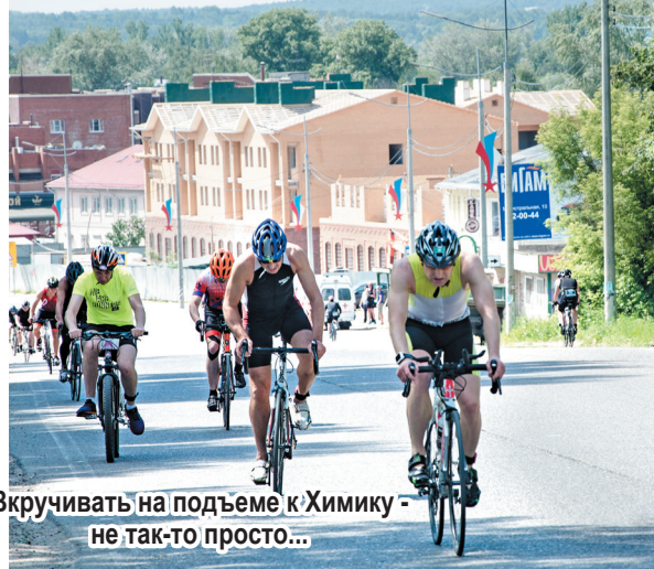
Вкручивать на подъеме к Химику - не так-то просто...

Продуманная трасса, электронная фиксация результатов, отменная погода, хорошая природа - все способствовало спортивному настрою.