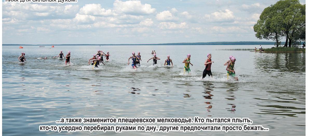
...а также знаменитое плещеевское мелководье. Кто пытался плыть, кто-то усердно перебирал руками по дну, другие предпочитали просто бежать...