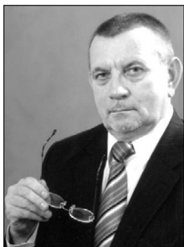
Рубрику веде Володимир ІЛЬІН , доктор філософських наук, професор Київського національного університету імені Т. Шевченка

“Хабарники повинні тремтіти, якщо вони накрали лише скільки потрібно для них самих. Коли ж вони награвували достатньо для того, щоб поділитися з іншими, то їм нічого більше боятися”.