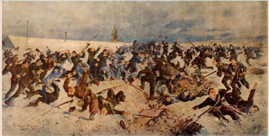
«Бій під Крутами (Українські Термопіли)» – листівка авторства Олександра Климка, 1936 р.

8 грудня 1917 року більшовицькі червоногвардійські загони під проводом одного з керівників жовтневого перевороту в Петрограді Володимира Антонова-Овсієнка увійшли в Харків і протягом доби завладіли містом. Уже через чотири дні за сприяння Ради народних комісарів Росії, більшовики провели в місті Всеукраїнський з'їзд Рад, на якому проголосили створення Радянської УНР зі столицею в Харкові. Влада Української Народної Республіки на чолі із Центральною Радою визнавалася нелегітимною. 17 грудня Центральний виконавчий комітет радянської УНР проголосив маніфест про скидання влади Україн-