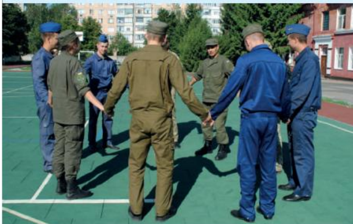
Групове тренінгове заняття

Підполковник Олег ДОН