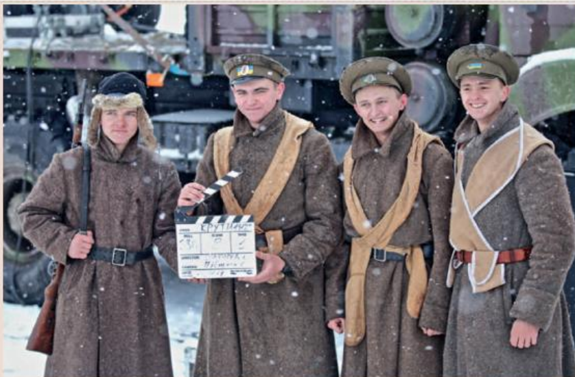
На осінь 2018 року заплановано прем'єру вітчизняного кінофільму «Крути 1918. Захист», до зйомок у якому долучилися близько 150 бійців НГУ

Адже на двох фото з похорон (до речі, у підписах, якими вони супроводжувались, немає ані натяку про Аскольдову могилу),