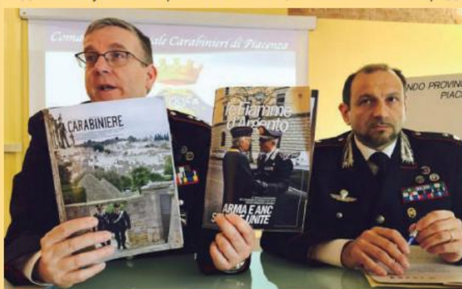
Ілюстрований журнал Військ карабінерів Італії «Il Carabiniere» заснований у 1872 і є одним із «старожилів» ринку друкованих ЗМІ країни