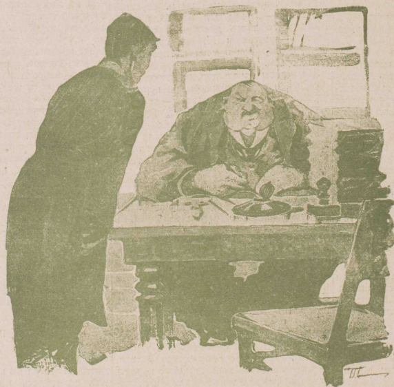
КЪ РАЗСКАЗУ «СЫЩИКОВЫ ИМЕНИНЫ».

Они интересны не столько психологически, сколько этнографически.