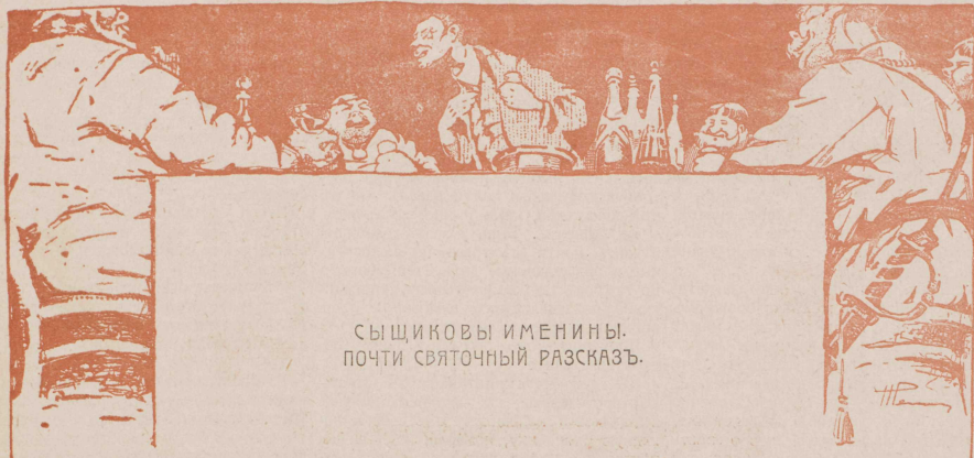
СЫЩИКОВЫ ИМЕНИНЫ. ПОЧТИ СВЯТОЧНЫЙ РАЗКАЗЪ.

Был Сыщик именинник. И собралось у него гостей видимо не видимо: сыщики, городовые, провокаторы, жандармы, три казака, два хоругвеносца, наборщик из «Новаго Времени», репортер изъ «Свѣта», два охранника, товарищ прокурора, цензоръ, приставъ, старшихъ дворниковъ видимо не видимо.