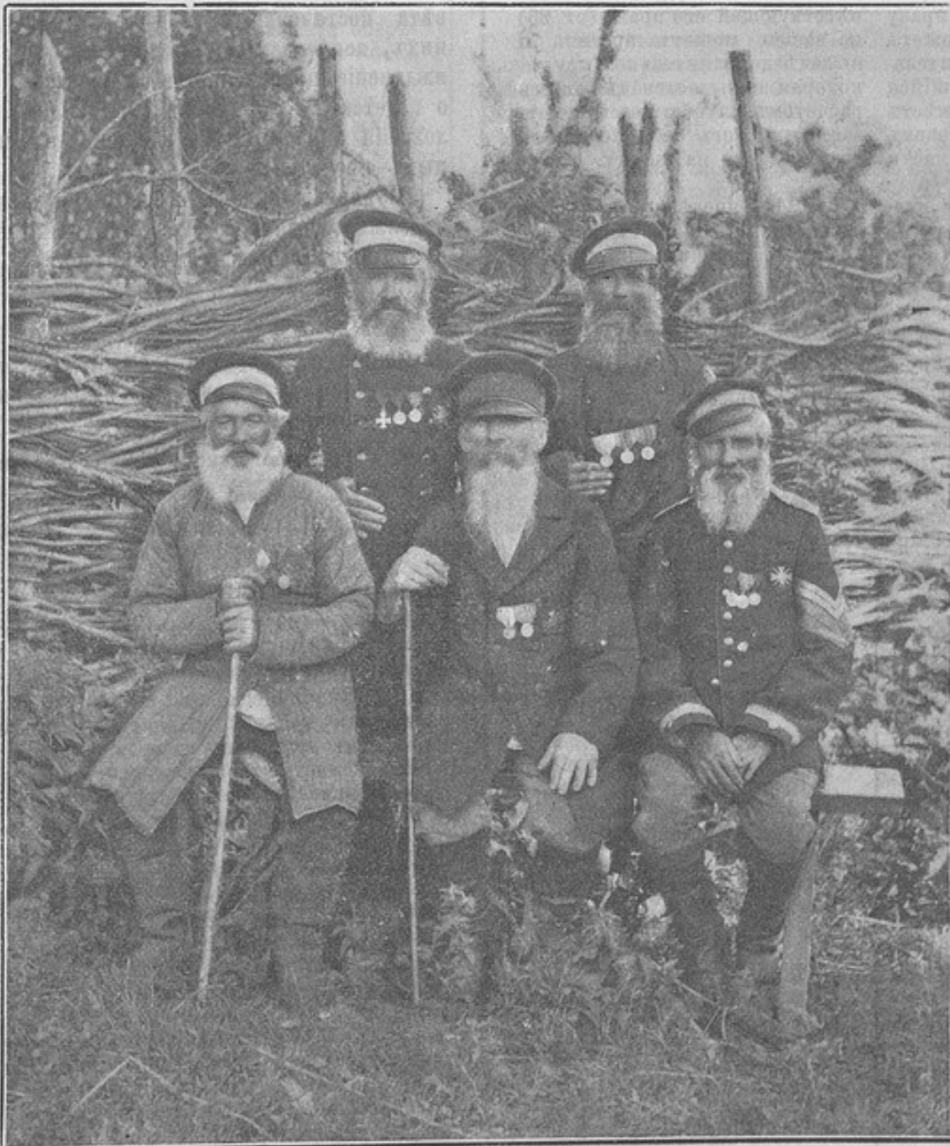
Пять стариковъ Куринскаго полка, участниковъ Даргинской экспедиціи 1845 г., проживающихъ въ укрѣпленіи Ведено.

Пять стариковъ Куринскаго полка, участниковъ Даргинской экспедиціи 1845 г., проживающихъ въ укрѣпленіи Ведено (рисунокъ). — Приказы по военному вѣдомству. — Изъ рѣшеній главнаго военнаго суда 1897 г. — Разныя распоряженія. — Пустой мріють для круглыхъ сиротъ офицерскаго званія. В. Березовскій. — Куринскій альбомъ (съ рисунками). — Афганскія войны. Л. Соболевъ. — Лишняя дивизія безъ расходовъ для казны. А. Т-ичъ. — Общество взаимопомощи Донскихъ офицеровъ. Н. Ревуновъ. — Австрійскіе гусары. Т-сг. — Ротные помощники (рисунокъ). — Похороны. Д. Н. Лоюфетъ. — Новыя изданія: Постановленія по довольствію войскъ. А. Барсовъ. М. Т.