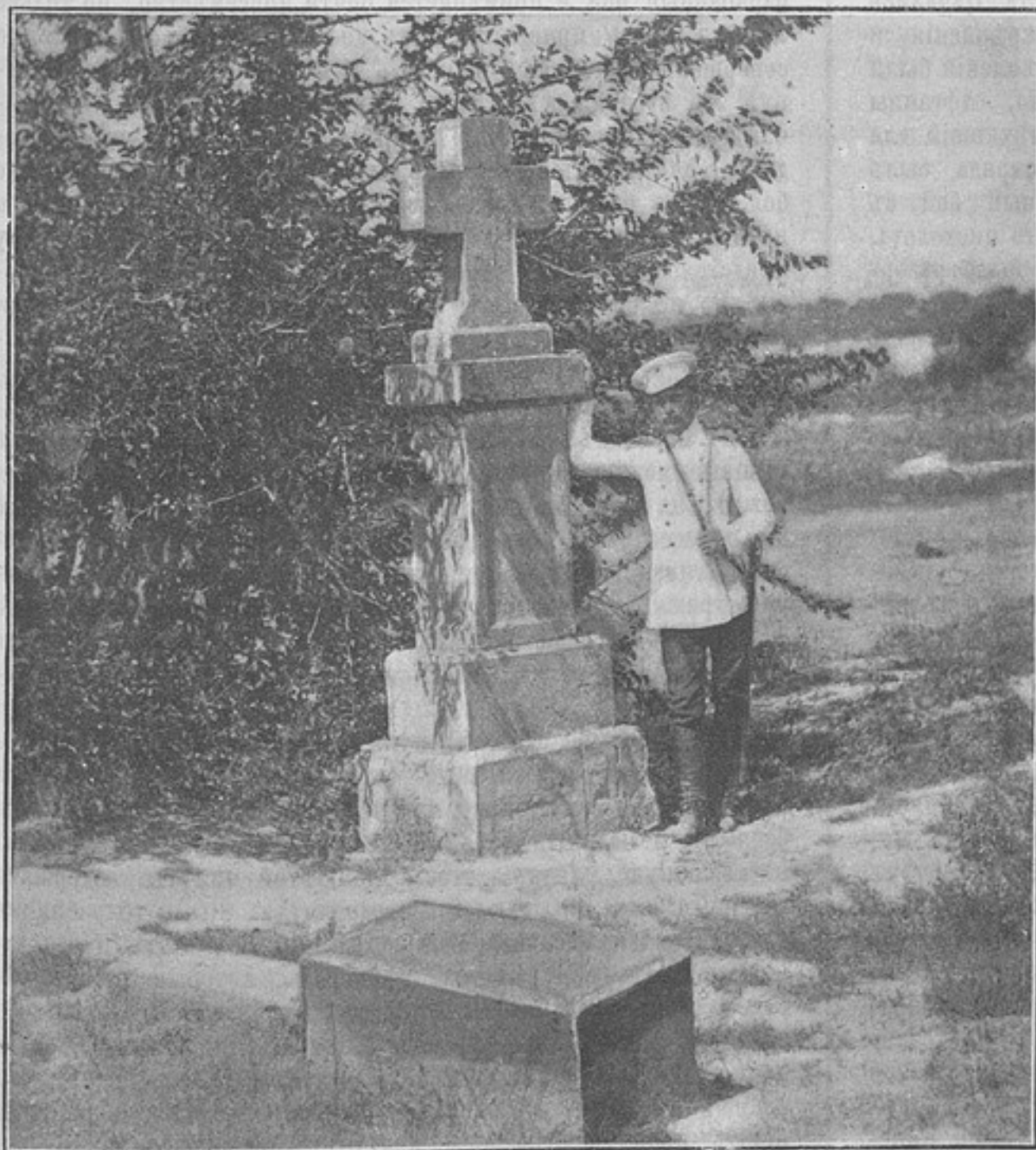
Памятникъ убитымъ куринцамъ во время послѣдняго возстанія 1877 года въ Дагестанѣ (къ статьѣ «Куринскій альбомъ»).

Населеніе, любившее Достъ-Магомета, молча взирало на перемѣну власти. Войска англичанъ заняли Баміанскій проходъ и