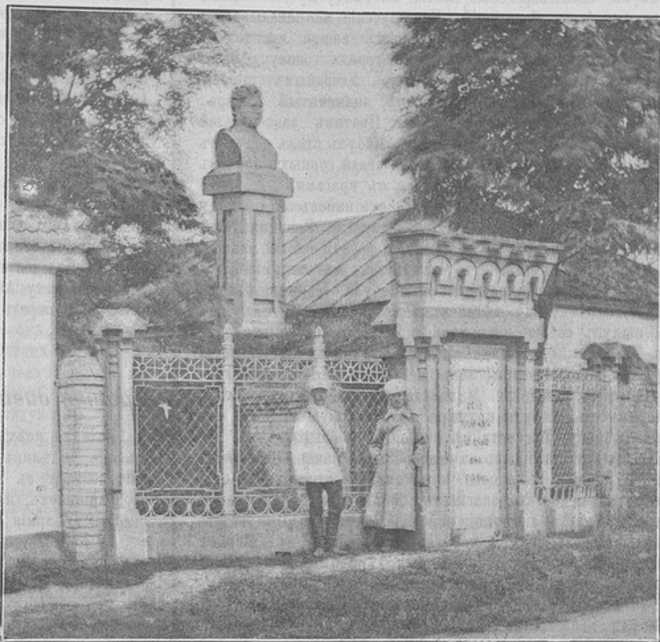
Памятникъ генералу Ермолову и землянка, въ которой онъ жилъ при постройкѣ крѣпости Грозной въ 1819 г. (къ статьѣ «Куринскій альбомъ»).

Случайно въ это время въ Кабулѣ находился прапорщикъ русской службы Виткевичъ. Наслышавшись о могуществѣ Россіи, Достъ-Магометъ черезъ Виткевича сдѣлалъ предложеніе о своемъ союзѣ съ Россіею и Персіею. Между тѣмъ Бернсъ сдѣлалъ нѣсколько обѣщаній эмиру, но индійское правительство не согласилось исполнить ихъ. Получивъ рѣзкій отвѣтъ отъ вице-короля, эмиръ, раздраженный, призвалъ къ себѣ 20-го января 1838 г. Бернса и сказалъ ему: «я стучался къ вамъ въ дверь, но вы меня отвергли. Правда, Россія слишкомъ далеко; но черезъ Персію, которая принадлежитъ Бѣлому Царю такъ же, какъ вамъ Индія, Россія мо-