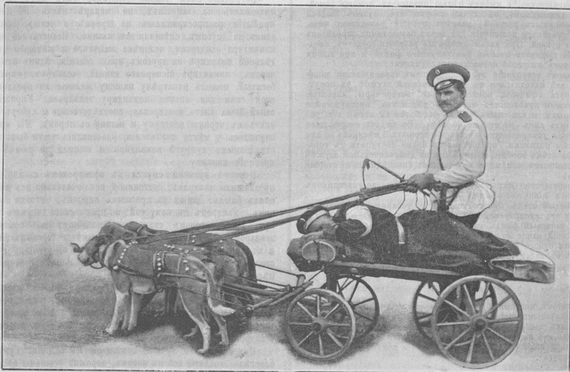
Ротные помощники (къ корреспонденціи «Лагерь подъ г. Бобруйскомъ»).

двѣ простыни и бѣлое байковое одѣяло. Для провѣтриванія кровать днемъ открыта. По стѣнамъ, въ особыхъ стойкахъ, стояли карабины и вынутыя изъ ноженъ сабли; клинки полированные. Въ казармѣ около 12° тепла.