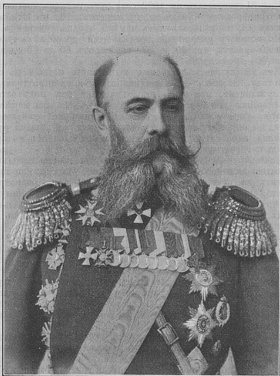
Командующій войсками Виленскаго военнаго округа, генералъ-отъ-инфантеріи, Оскаръ Казимировичъ ГРИППЕНБЕРГЪ.

Деньги могутъ быть высланы почтовыми марками каждая не дороже 50 к. Безденежная подписка не принимается. За перемѣну адреса 28 к. Отдѣльные №№ высылаются за 15 к. Объявленія принимаются по особой расцѣнкѣ, высланной по требованію.