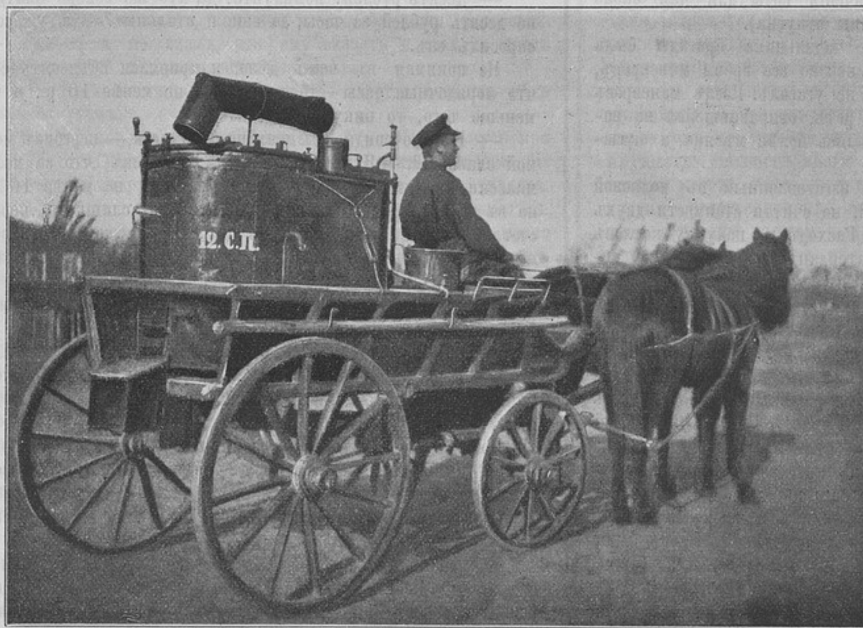
Походная кухня (рис. № 4).

два цилиндра, какъ гнѣзда для мѣдныхъ котловъ съ герметическими крышками.