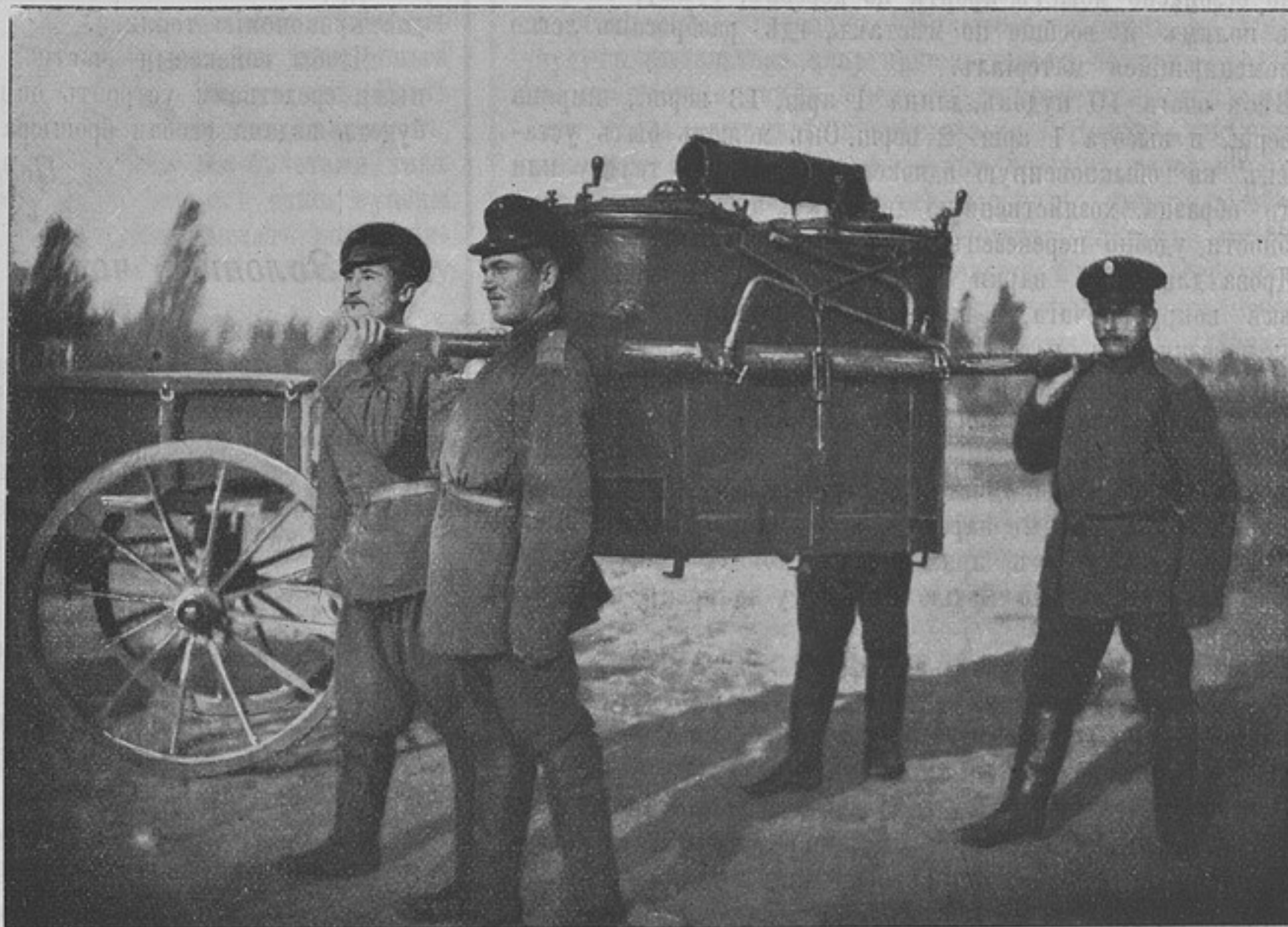
Походная кухня (рис. № 3).

товъ, другое малое для пара и раздачи кипяченой воды для чая, посредствомъ особо приспособленной сифонной трубки. Дымовая труба складная съ приспособленіемъ для поворотовъ ея по вѣтру. Внизу очага придѣланы желѣзные лапы для