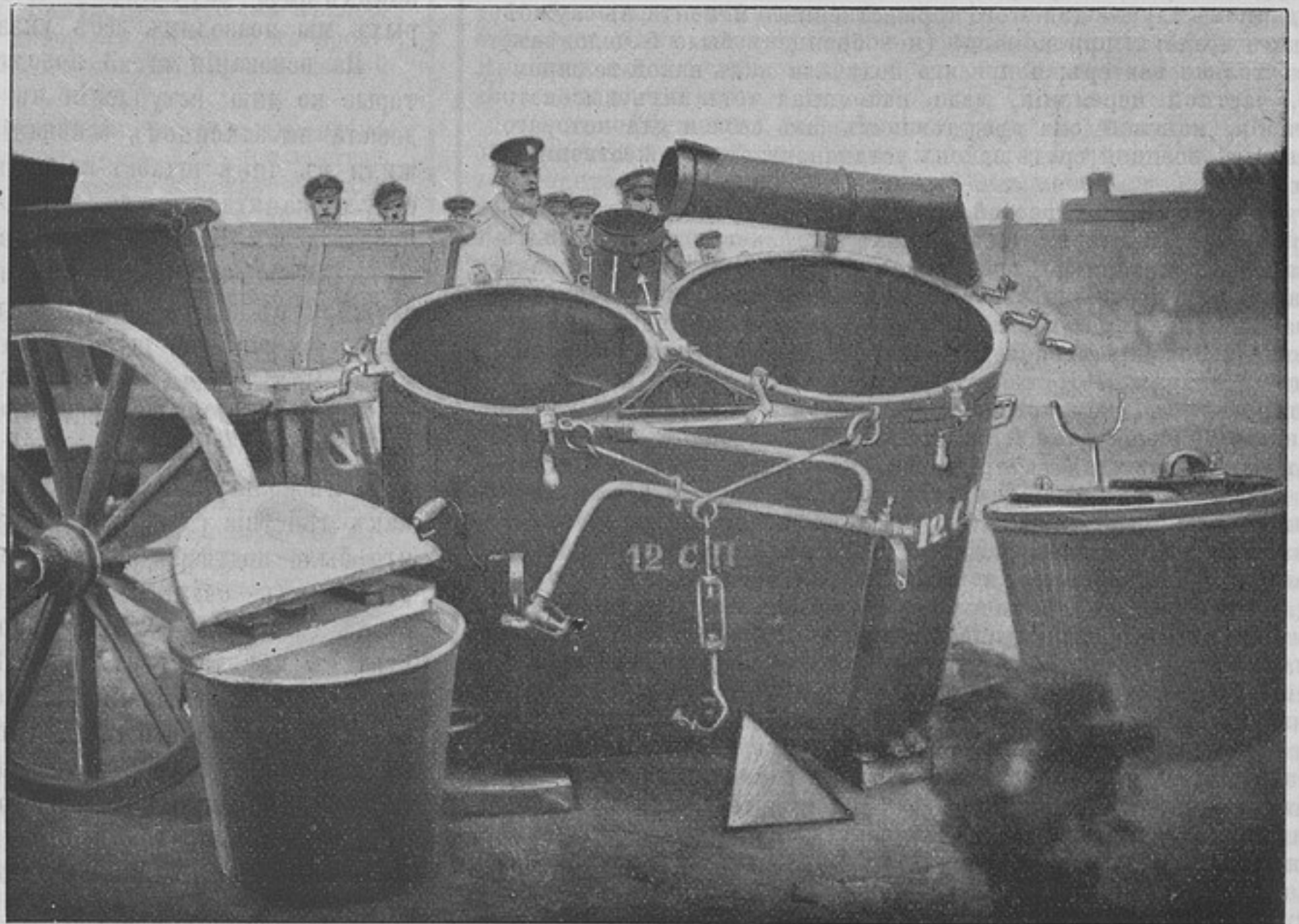
Походная кухня (рис. № 1).

Съ такими системами походныхъ кухонъ еще можно было бы мириться, если бы онѣ были войскамъ доступны по цѣнѣ; но дѣло въ томъ, что и системы ихъ не вполне удовлетворяютъ потребностямъ войскъ: по своей подвижности,