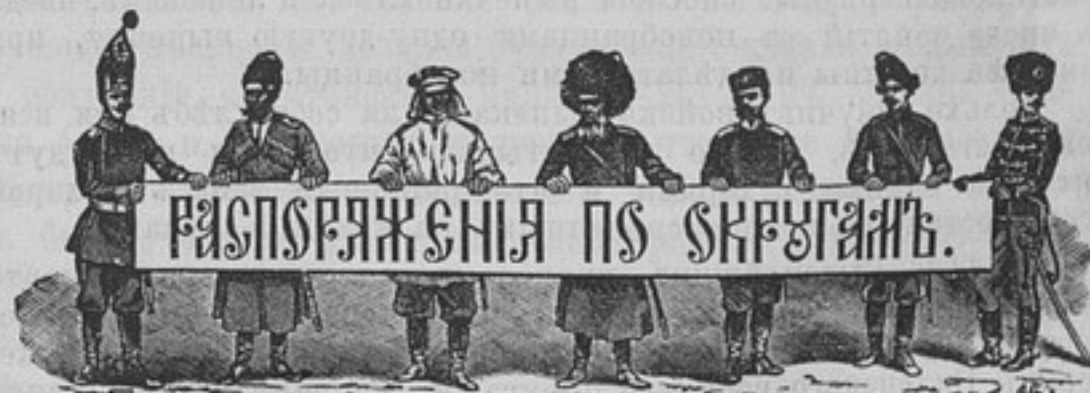
Приказаніе войскамъ Варшавскаго военнаго округа