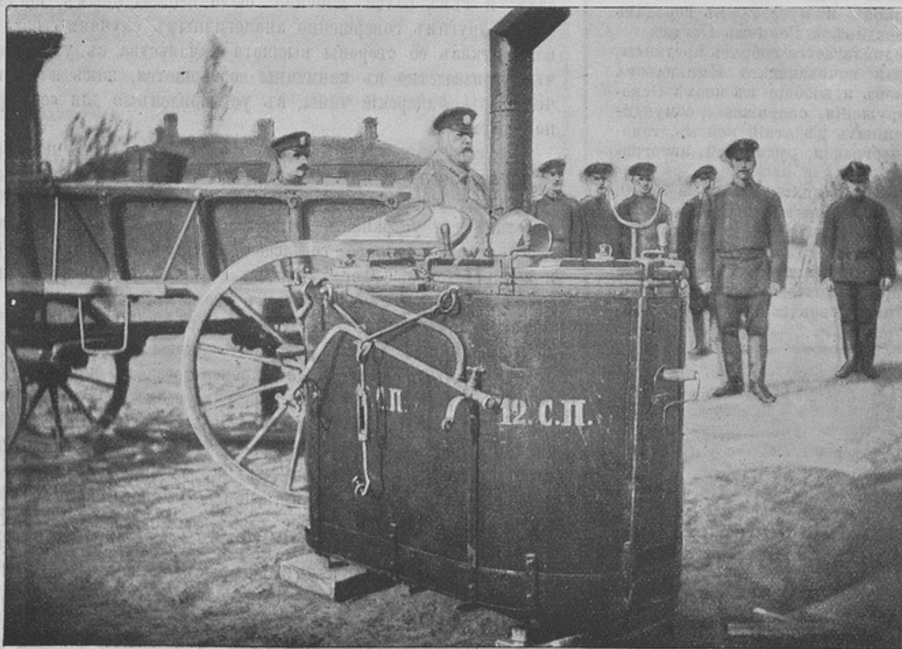
Походная кухня (рис. № 2).

конструкціи и, емкости и цѣна слишкомъ высока 600—800 рублей на роту, эскадронъ. Завести такія кухни для всѣхъ частей, это много миллионный расходъ. Кромѣ того желательно, чтобы походныя кухни не хранились только въ неприкосновенныхъ запасахъ, а примѣнялись и въ мирной обстановкѣ, и такимъ образомъ войска могли бы воочию убѣдиться въ ихъ полной пригодности, да и тѣ, кому придется въ минуту надобности примѣнять ихъ къ дѣлу, имѣли бы возможность заблаговременно ознакомиться съ ними и прироровиться къ нимъ при походныхъ движеніяхъ, перѣздахъ по желѣзнымъ дорогамъ и въ плаваніяхъ на плотахъ, баржахъ и пр. Думаю, что кухня такого типа, которая, не составляя одного нераздѣльно цѣлаго съ колеснымъ ходомъ или специально устроенной для нея повозкой, можетъ быть поставлена и укрѣплена на всякой повозкѣ войскового обоза и въ случаѣ надобности легко перевозима и на обывательской подводѣ, наиболее желательна; конечно при условіи, чтобы она была не громоздка, не тяжеловѣсна, прочна, пригодна для приготовления горячей пищи на маршѣ, при