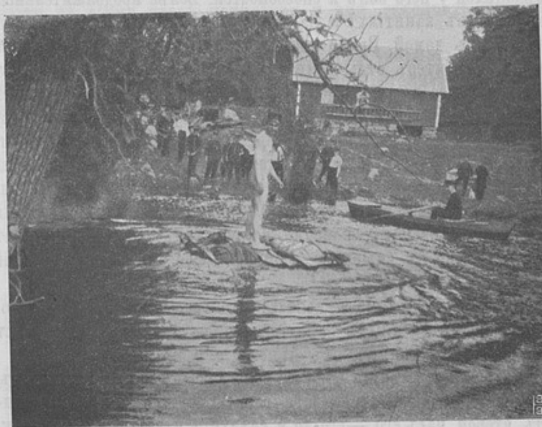
Шведская армія. Плоть на полотнищахъ палатокъ, набитыхъ сѣномъ.