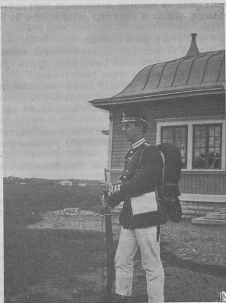
Шведская армія. Вольноопредѣляющійся въ старой формѣ.

нированности и цѣлесообразности движеній, и въ смыслѣ воспитательномъ.