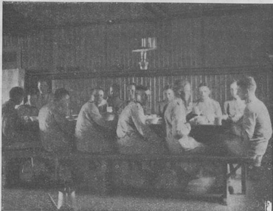
Шведская армія. Обѣдъ въ унтеръ офицерской школѣ.

Въ пунктѣ 3-мъ приказа по военному вѣдомству 1909 года № 100 объявлено, что Государь Императоръ Высочайше повелѣтъ соизволилъ разрѣшить ношеніе походнаго мундира взаимнѣ сюртука во всѣхъ случаяхъ, исключая посѣщенія Императорскихъ театровъ. Мѣсяцевъ черезъ семь послѣ объявленія этой Монаршей воли, приказаніемъ по войскамъ одного изъ округовъ запрещено ношеніе походнаго мундира при посѣщеніи «лотерей-алегри, любительскихъ спектаклей, концертовъ, семейно-танцевальныхъ и благотворительныхъ разнаго рода вечеровъ, а такъ же и субботокъ, устраиваемыхъ въ мѣстныхъ общественныхъ собраніяхъ». Такимъ образомъ походный мун-