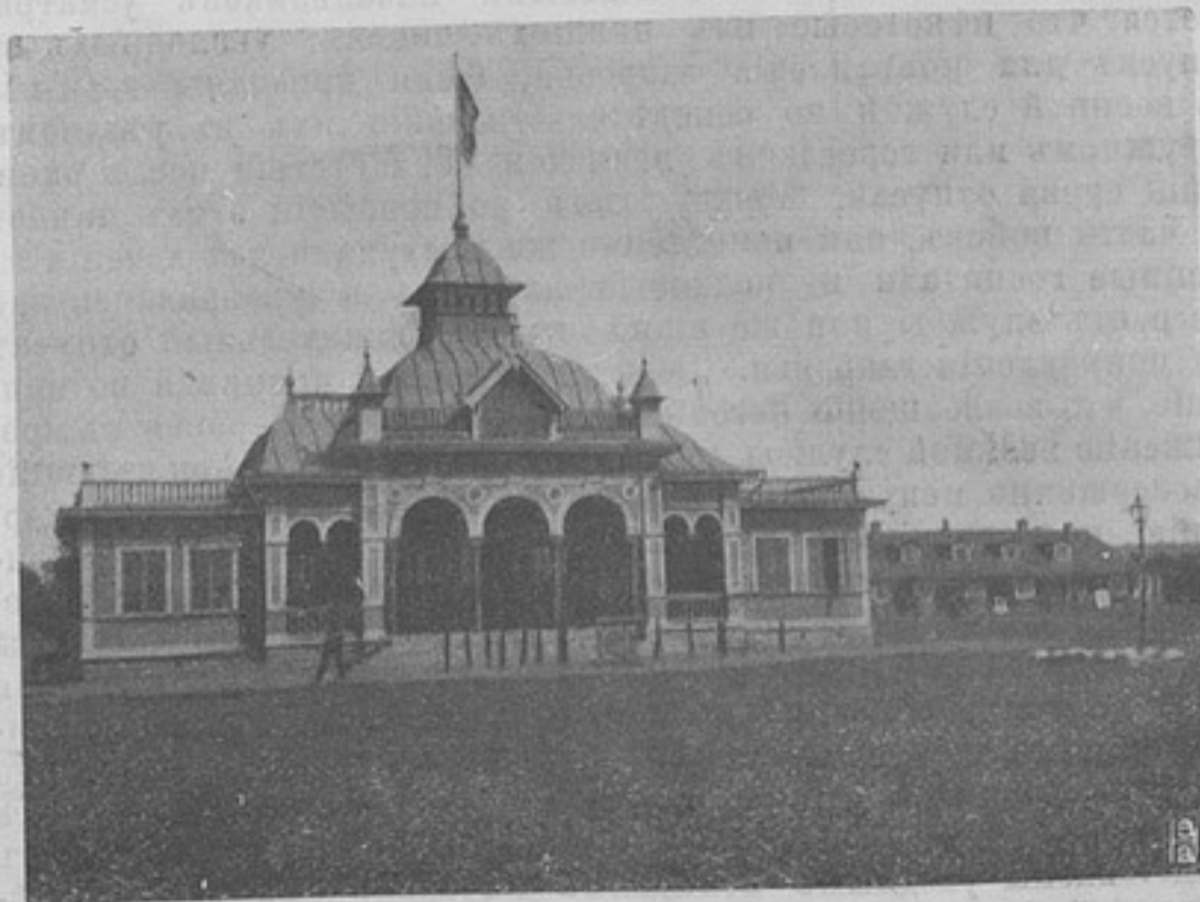
Гауптвахта шведскаго Королевскаго Скараборскаго полка. Направо казармы стараго типа.