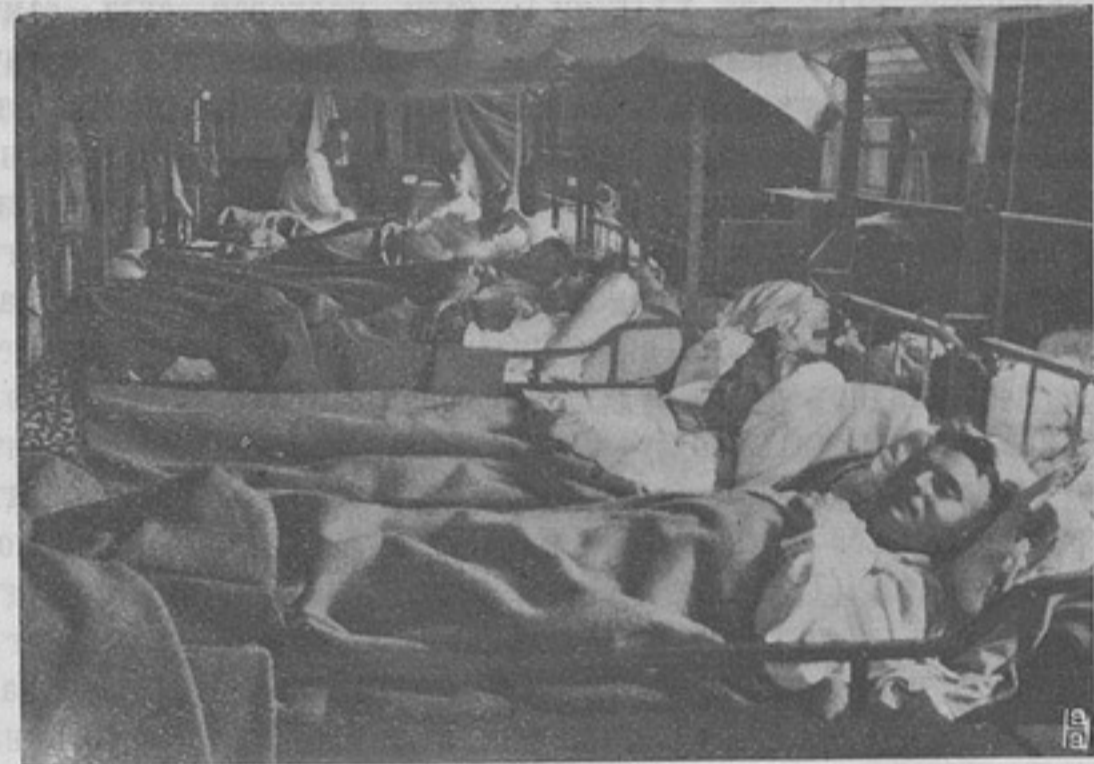
Шведская армія. Спальня въ старой казармѣ провинціального полка.

Нѣкоторыя затрудненія въ примѣненіи новаго закона могутъ встрѣтиться лишь въ отношеніи полковыхъ и равныхъ съ ними по власти судовъ. Само собою разумѣется, что какъ 1 ст. XXII кн. С. В. П. 1869 г., изд. 3, такъ и новыя