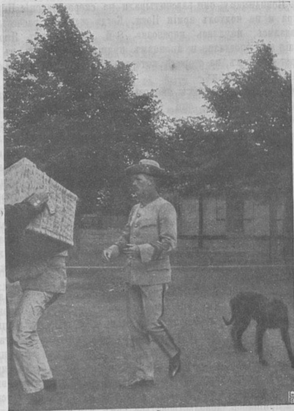
Шведская армія. Лейтенантъ 26-го пѣх. полка въ новой формѣ.

На ряду съ недостатками управленія нужно поставить неудобства, проистекавшія изъ перемѣшиванія войсковыхъ частей. Цѣлая дивизія была распредѣлена между другими частями; изъ отдѣльныхъ войсковыхъ единицъ, выдѣленныхъ