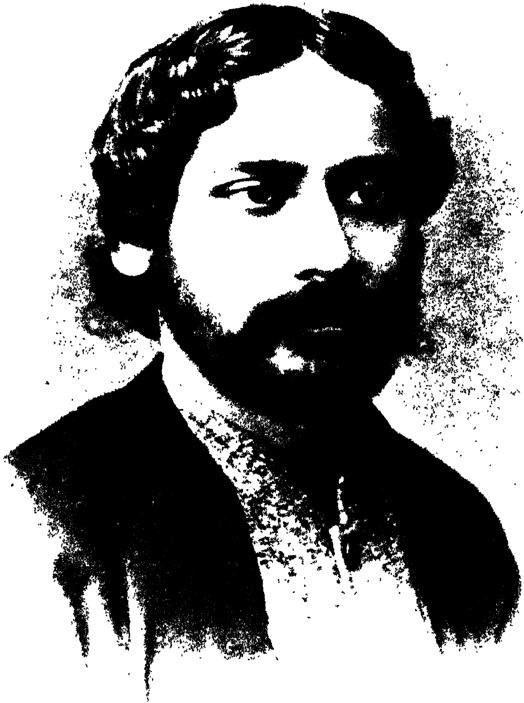
রবীন্দ্রনাথ আনুমানিক ১৩০৪ সালে