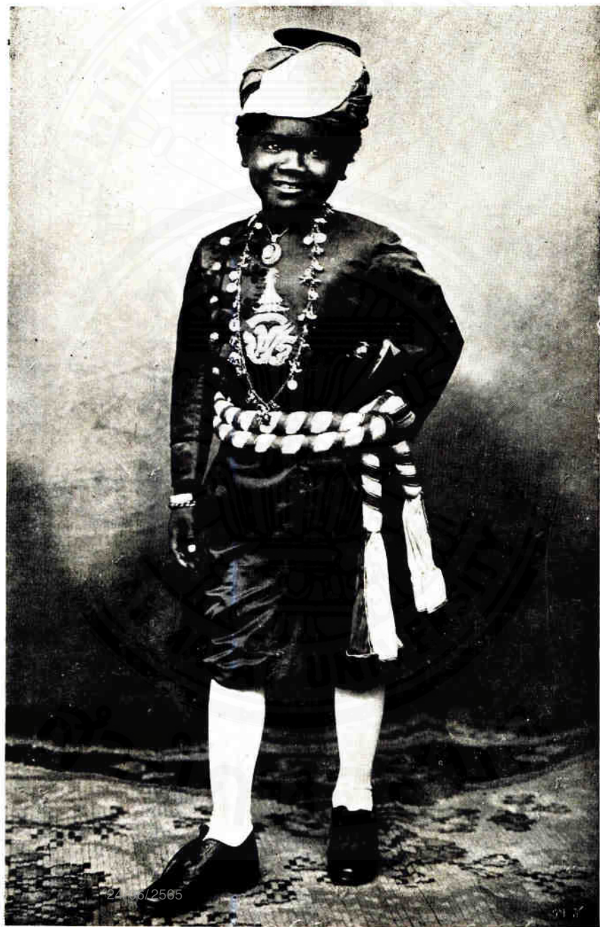
รูปนางคนึงแต่งเต็มยศตามเสด็จ