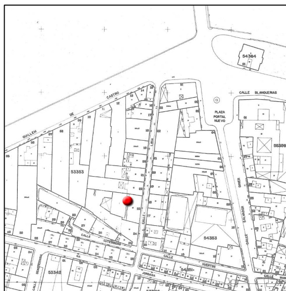
Cartográfico C.G.C.C.T 1980