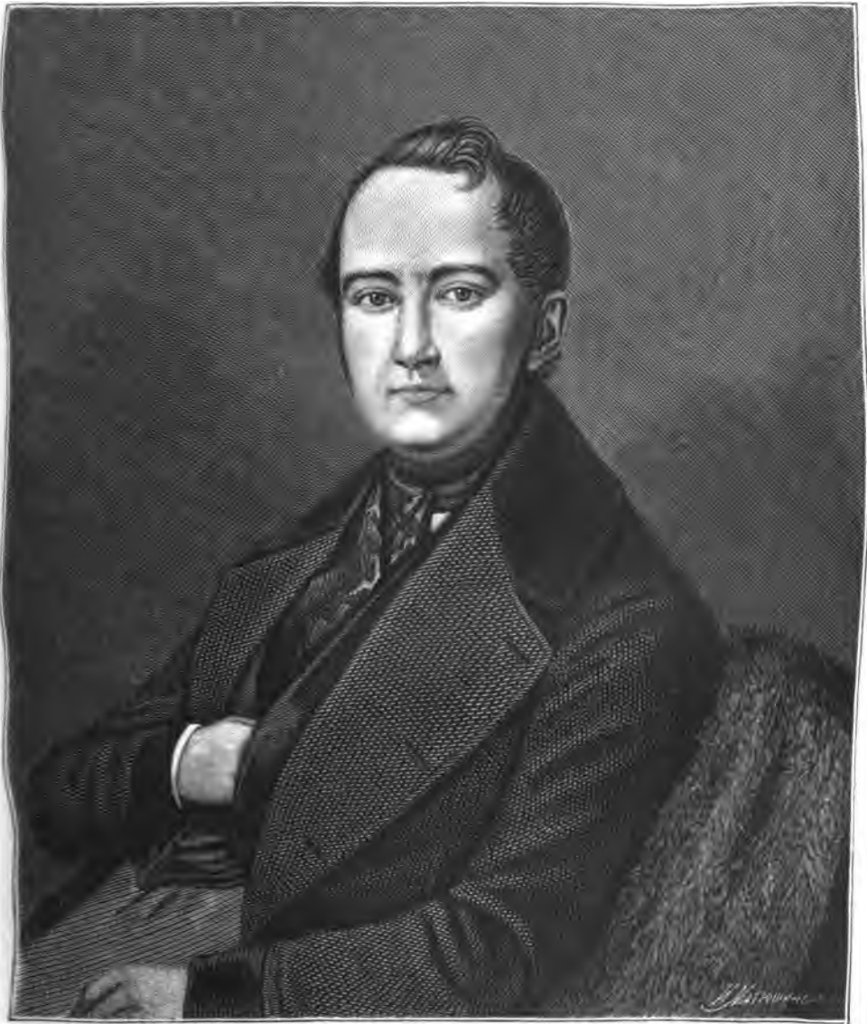
АНДРЕЙ ИВАНОВИЧЪ ПОДОЛИНСКІЙ