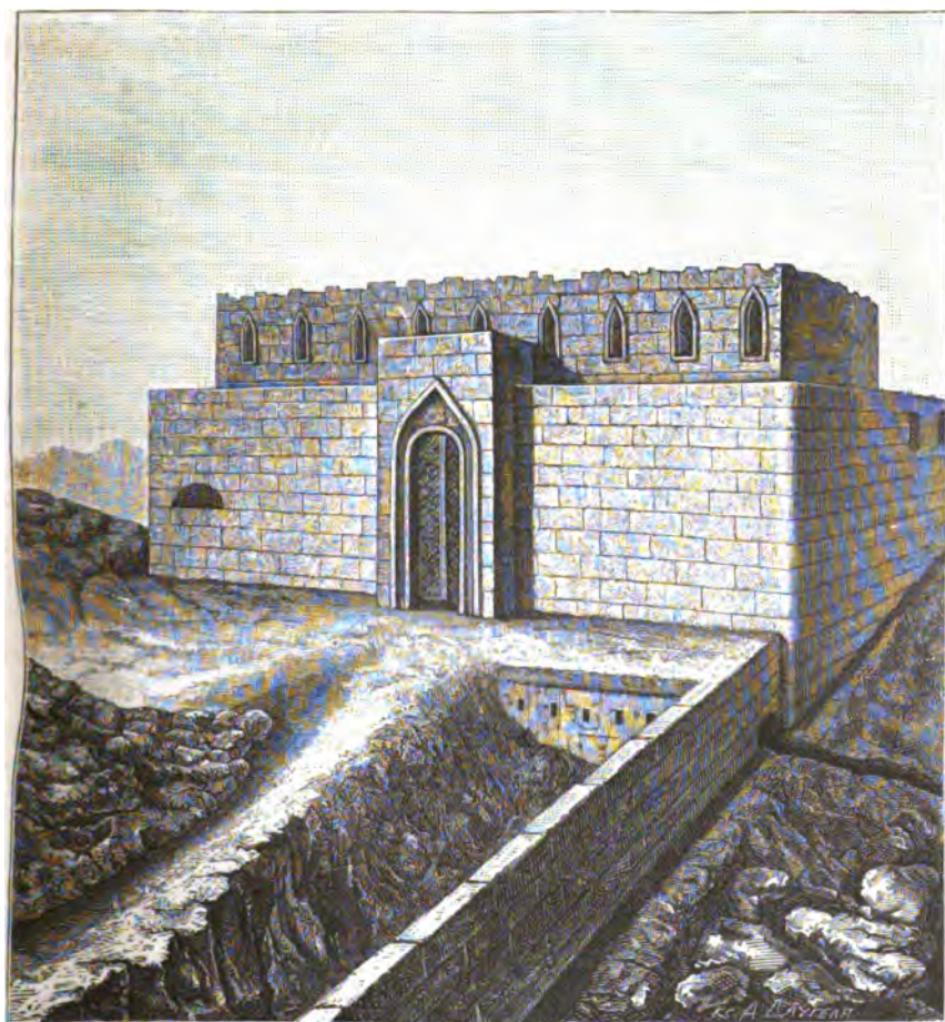
БАЯЗЕТЪ. ПЕРЕДНІЙ ФАСЪ ЦИТАДЕЛИ ВЪ 1877 Г.