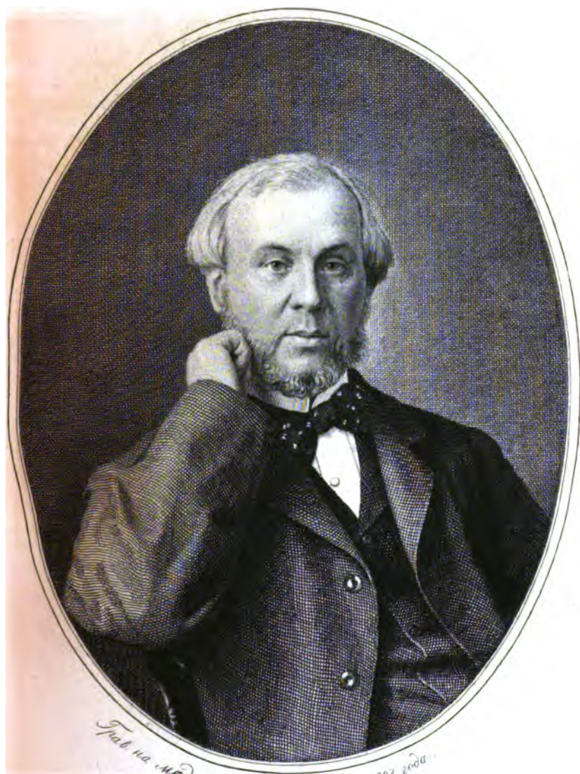
Портрет на млади Ив. Пържалостивъ. 1883 година.