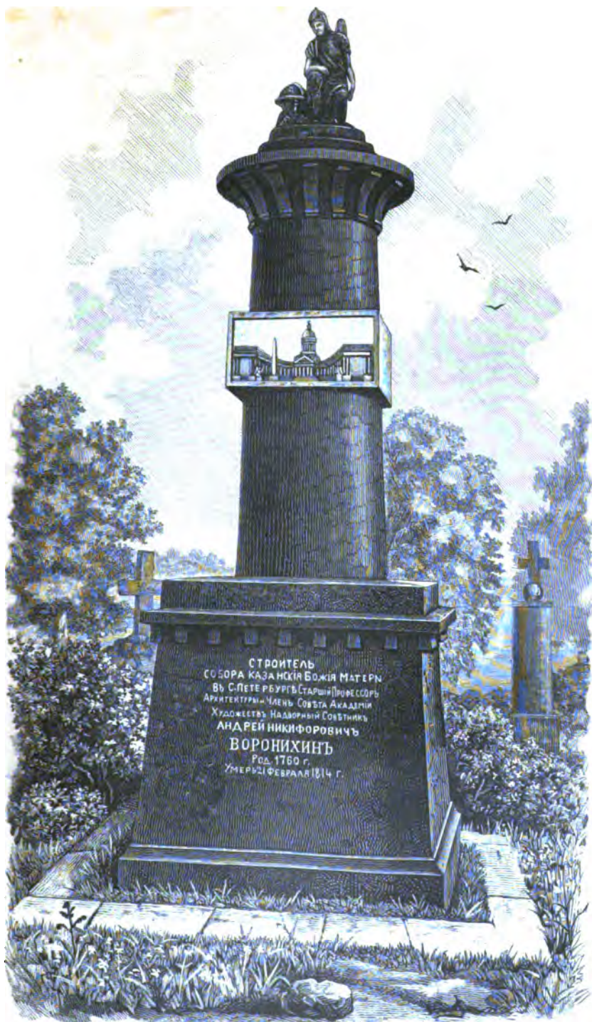
ПАМЯТНИКЪ НА МОГИЛѢ ВОРОНИХИНА, СТРОИТЕЛЯ КАЗАНСКАГО ВЪ С.-ПЕТЕРБУРГѢ СОБОРА.