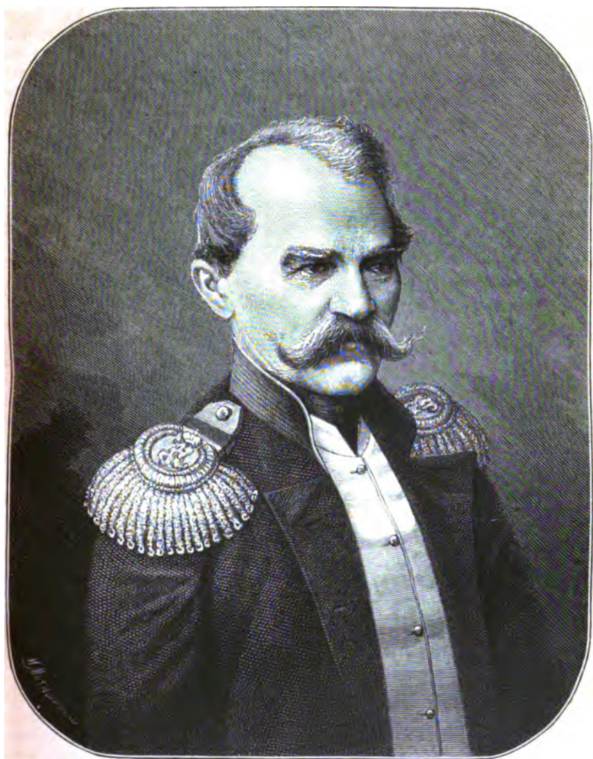
ГЕНЕРАЛЬ-АДЪЮТАНТЪ ВЛАДИМІРЪ ИВАНОВИЧЪ НАЗИМОВЪ РОД. 1802 † 1874 г.