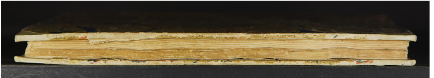
Magl. M.7.6 (a)