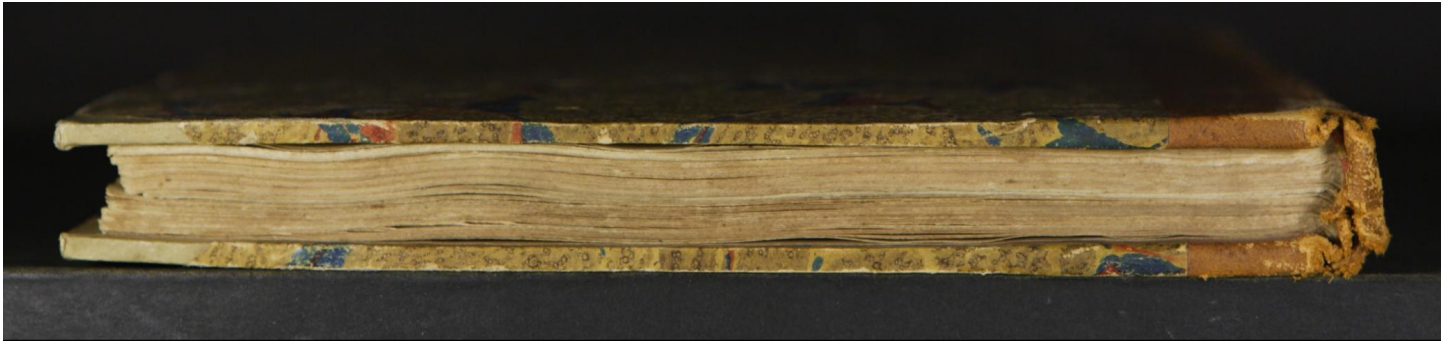
Magl. M.7.6 (a)