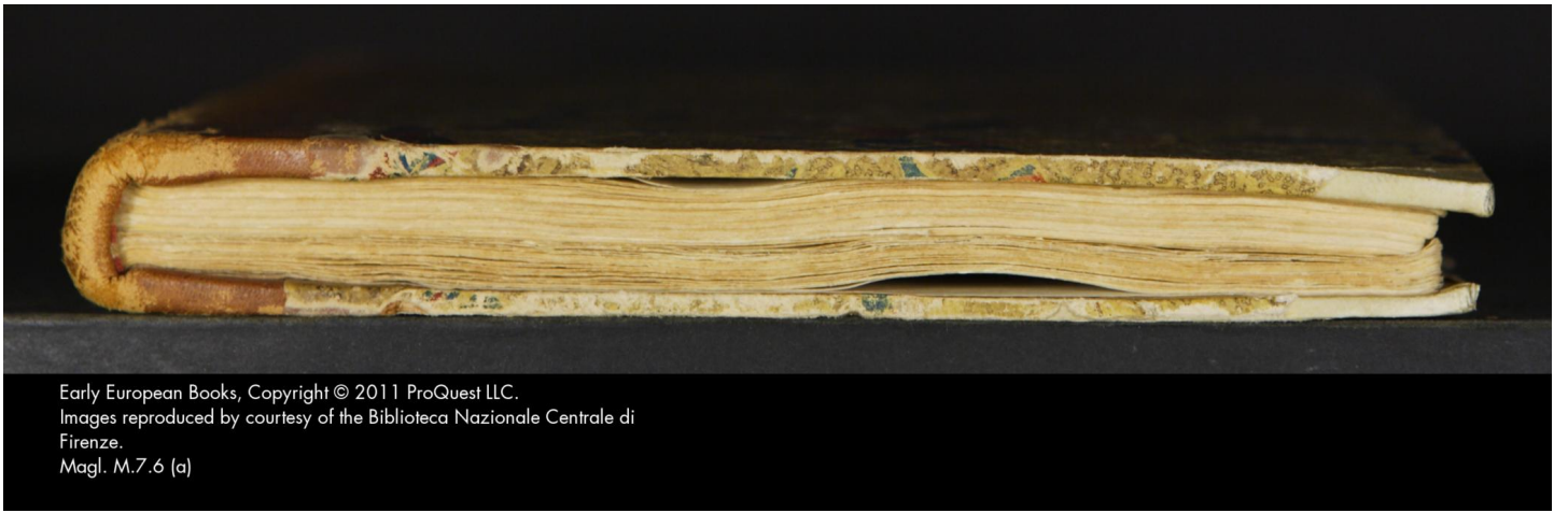
Early European Books, Copyright © 2011 ProQuest LLC. Images reproduced by courtesy of the Biblioteca Nazionale Centrale di Firenze. Magl. M.7.6 (a)