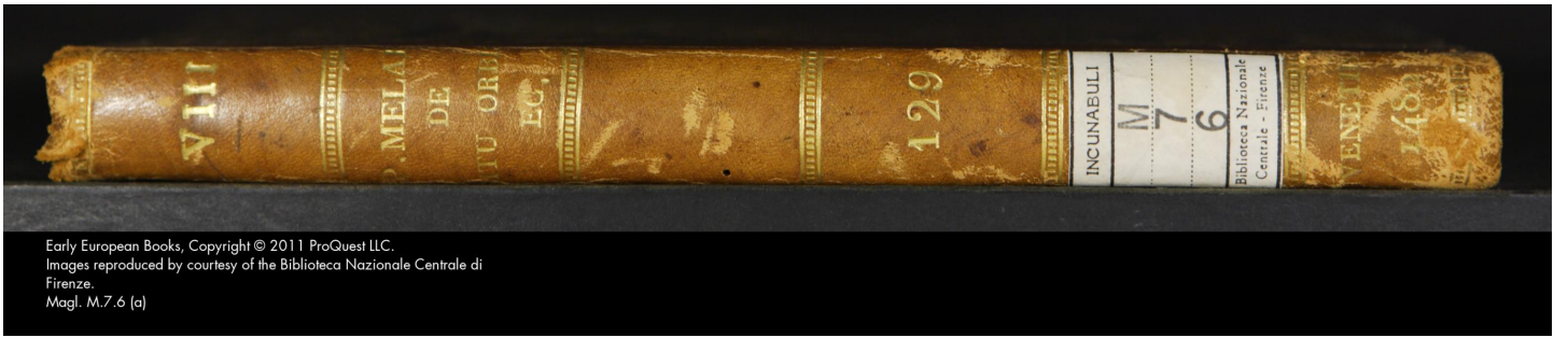
Early European Books, Copyright © 2011 ProQuest LLC. Images reproduced by courtesy of the Biblioteca Nazionale Centrale di Firenze. Magl. M.7.6 (a)