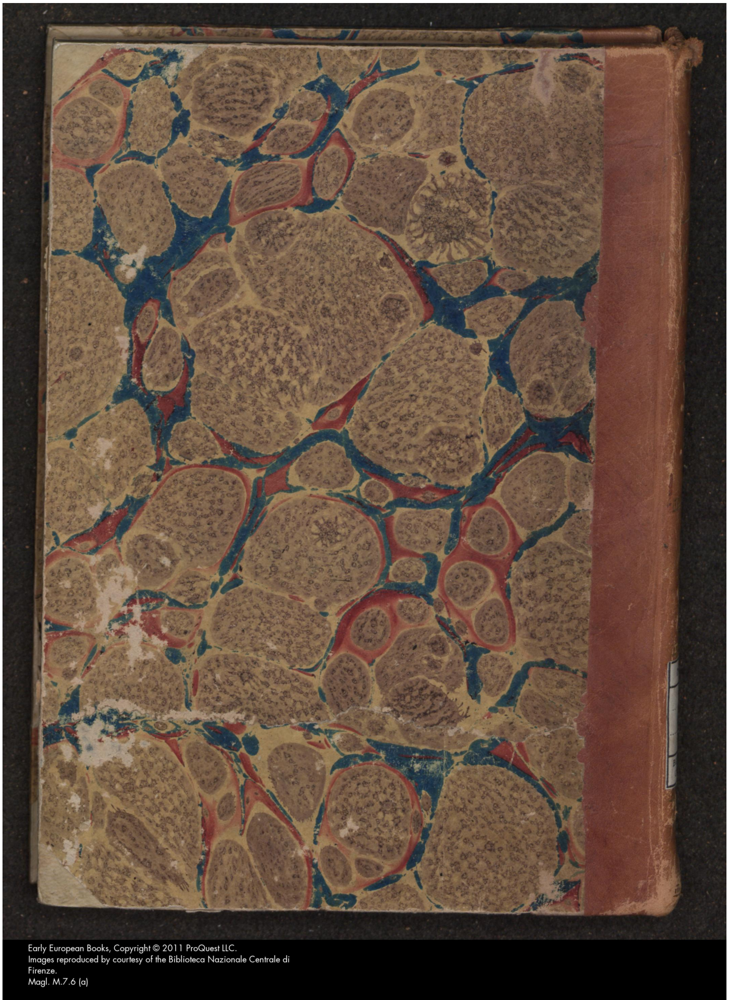
Magl. M.7.6 (a)