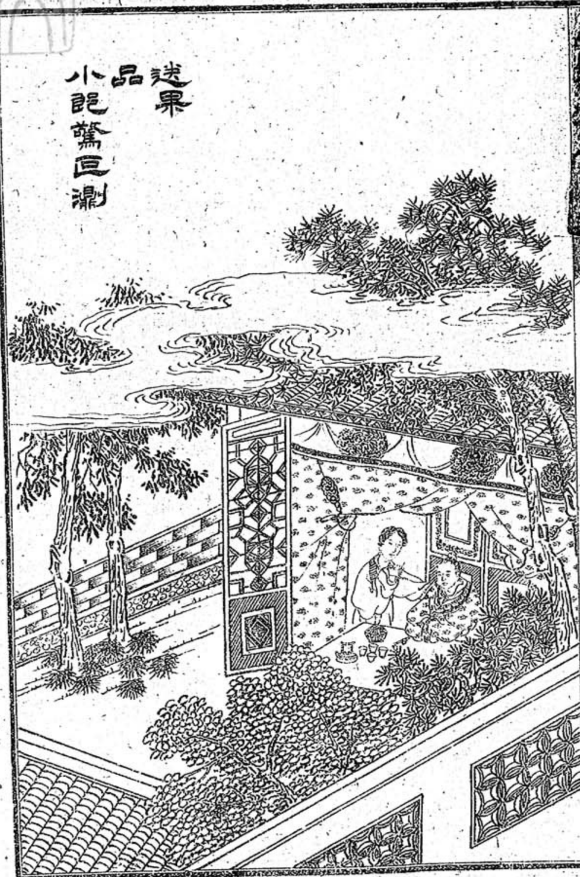
送果 品 小郎驚巨測