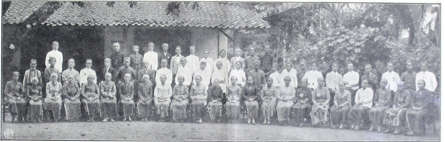
ပုသိမ်မြို့ရှိ ဝတ်စုံများကို ဝတ်ဆင်စေရန် ဝန်ထမ်းများ ပြုစုပေးခဲ့သည်။

၅ ပြည်သူ့အဖွဲ့အစည်းများဖြင့် ဝတ်စုံများကို ဝတ်ဆင်စေရန် ဝန်ထမ်းများ ပြုစုပေးခဲ့သည်။