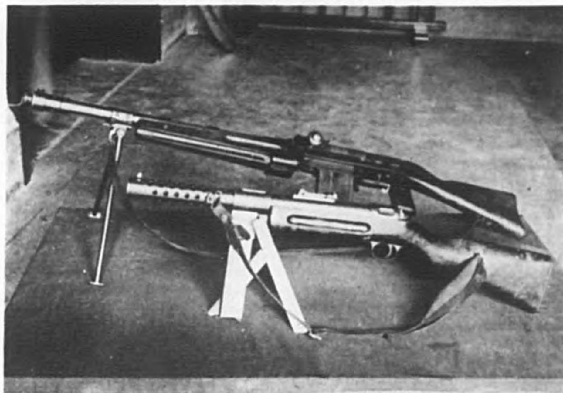
輕機關銃 自動短銃