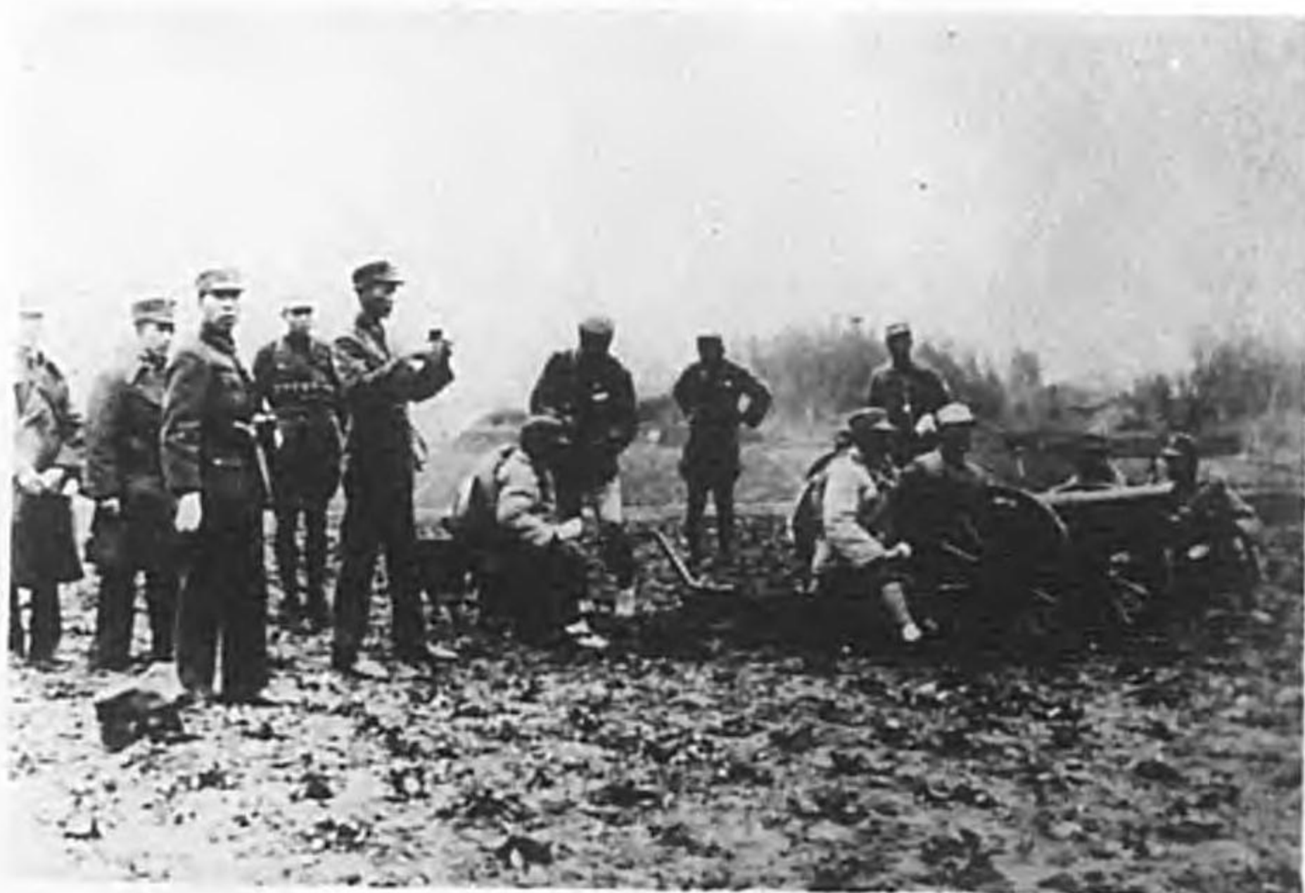
山 砲 眼鏡ヲ手ニセラルル蔡廷楷