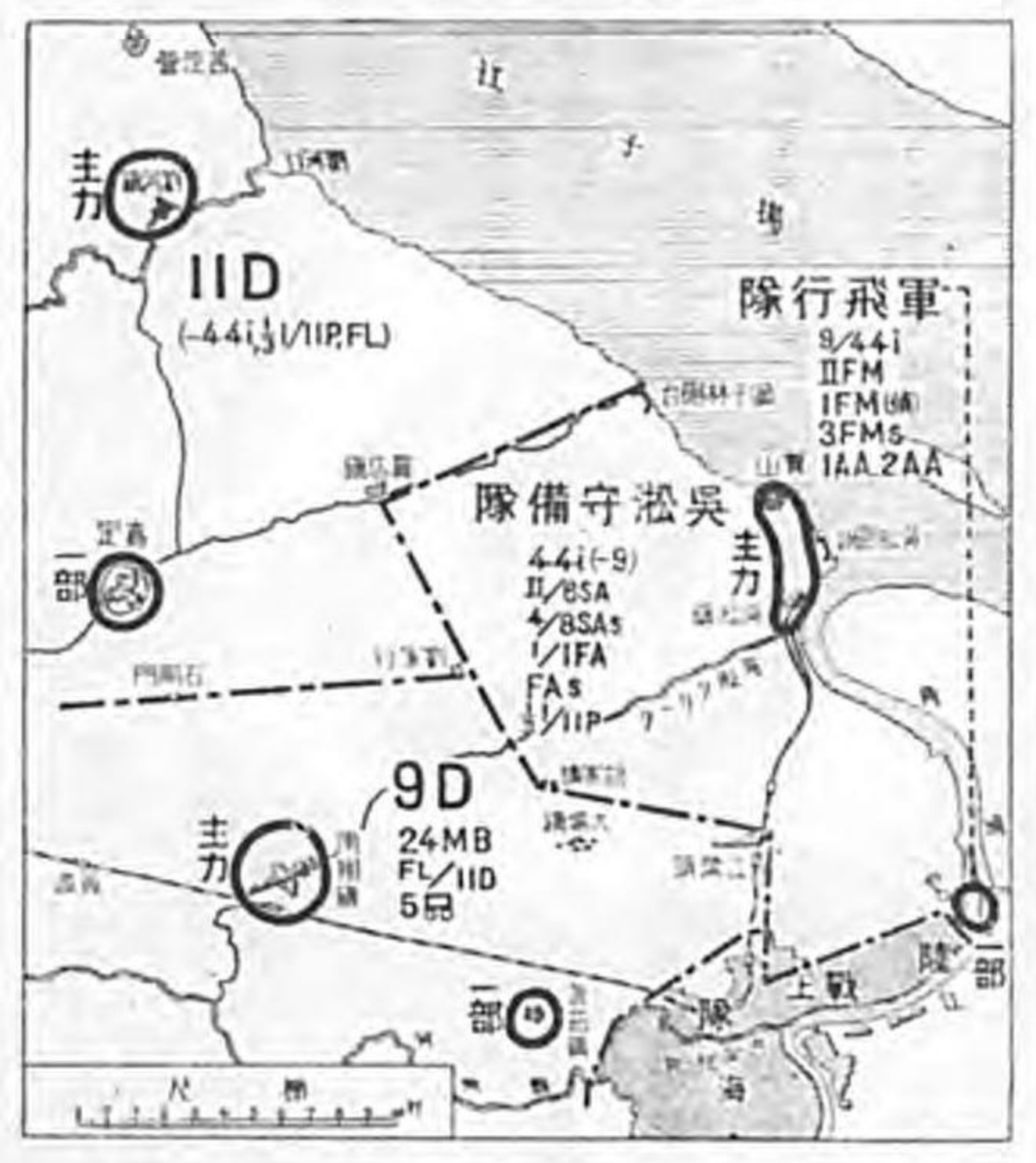
圖要區管備守軍遣派海上 日三月三年七和昭

四 吳淞守備隊 長泰步兵大佐、步兵第四十四聯隊(一中隊欠)、野戰重砲兵第六 攻城重砲兵(甲)第一聯隊第一中隊、獨立攻城重砲兵(丙)隊、工兵第十一大隊ノ一小隊ヲシテ歩兵一大隊 一中、隊欠 、獨立野戰重砲兵第八聯隊第四中隊、東端附近ニ、主力ヲ吳淞鎮及寶山附近ニ集結シ殘敵ノ排除、管内諸部隊及諸施設ノ警備ニ任セシ