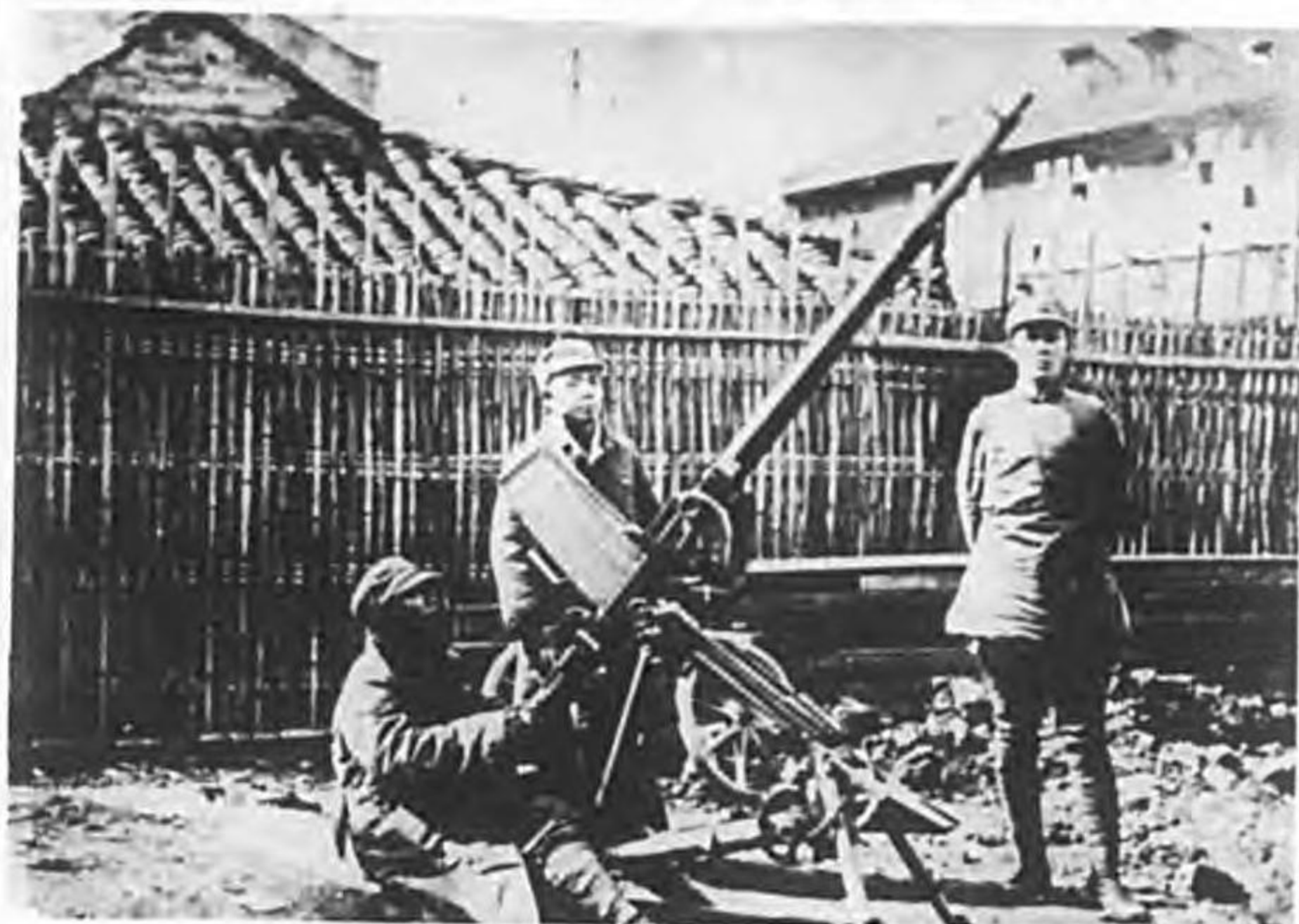
平射高兩用機關銃(エリコシ)式二〇耗)