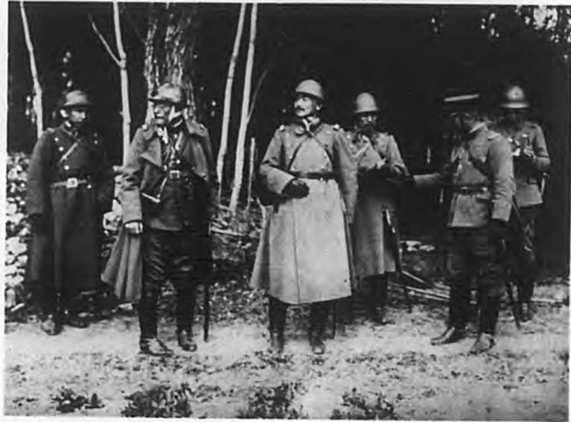
婁塘鎮附近ニ於ケル第十一師團司令部 前列向テ右ヨリ參謀長宅步兵大尉、參謀長宅步兵大佐、參謀長宅步兵大佐