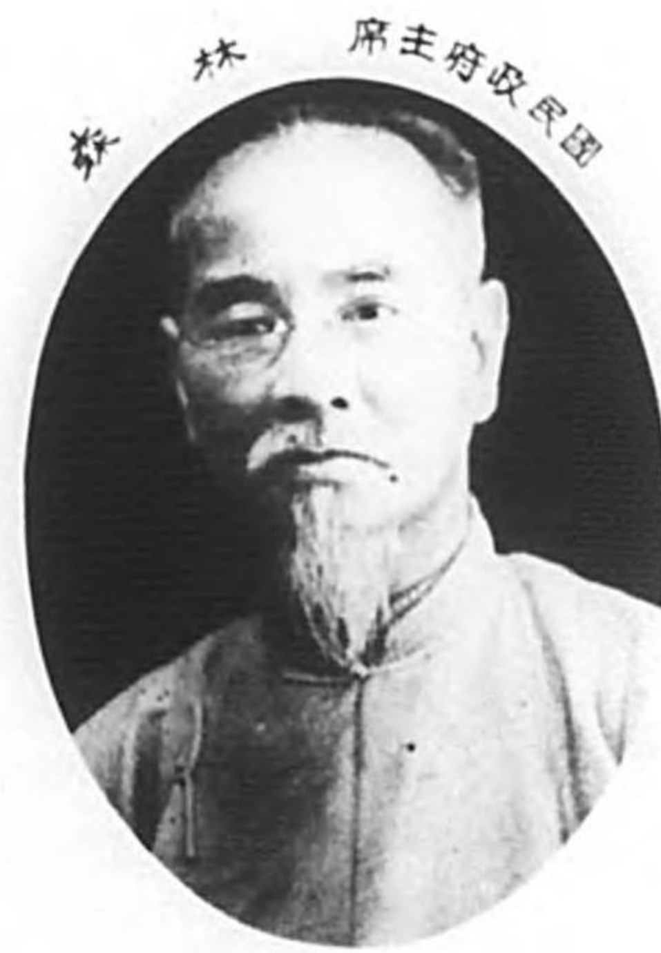
在南京國民政府主席 林