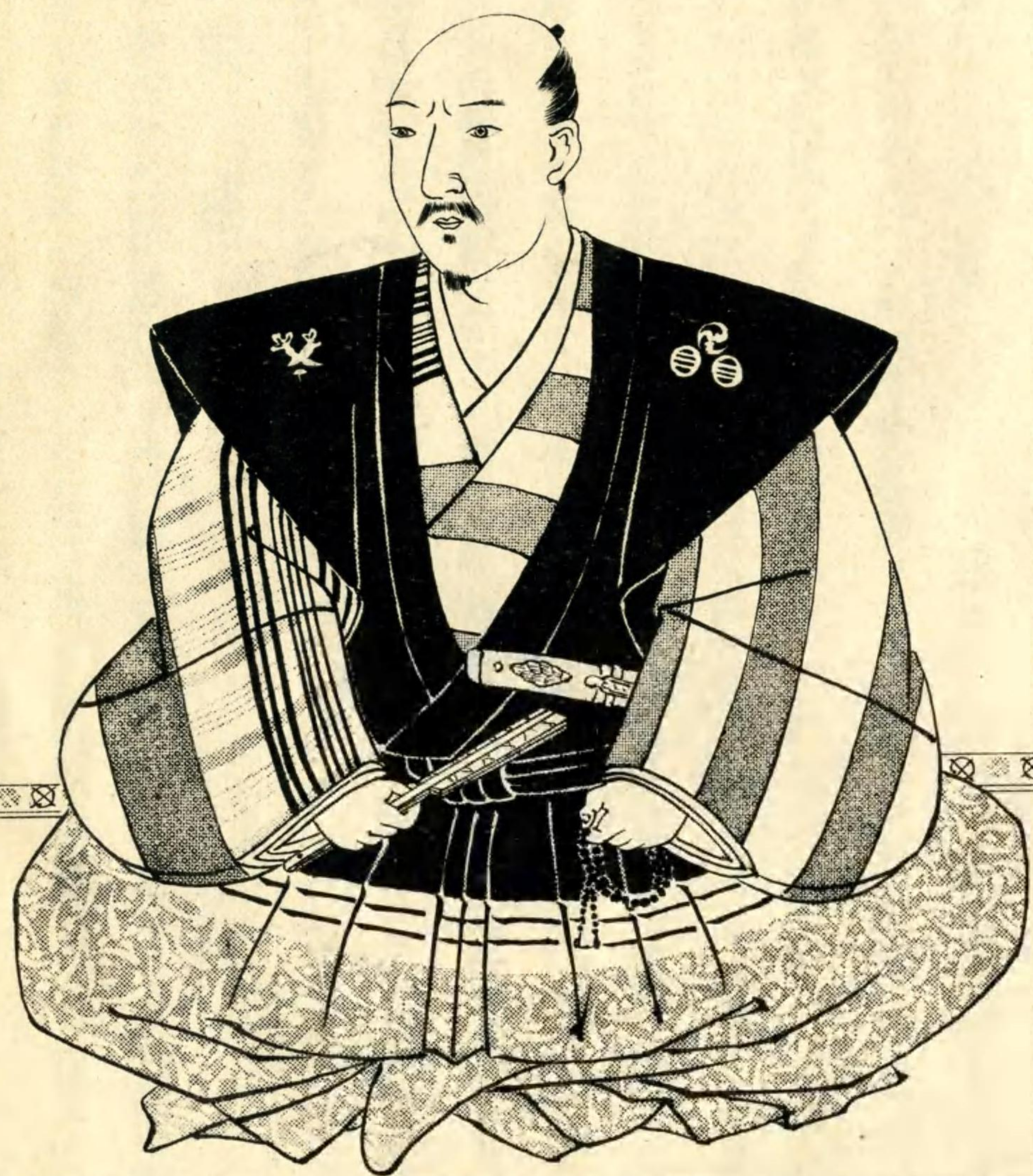
安藝守定朝臣肖像