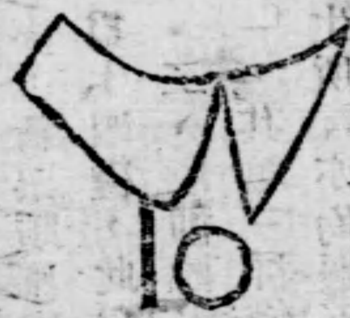
修 飾 版