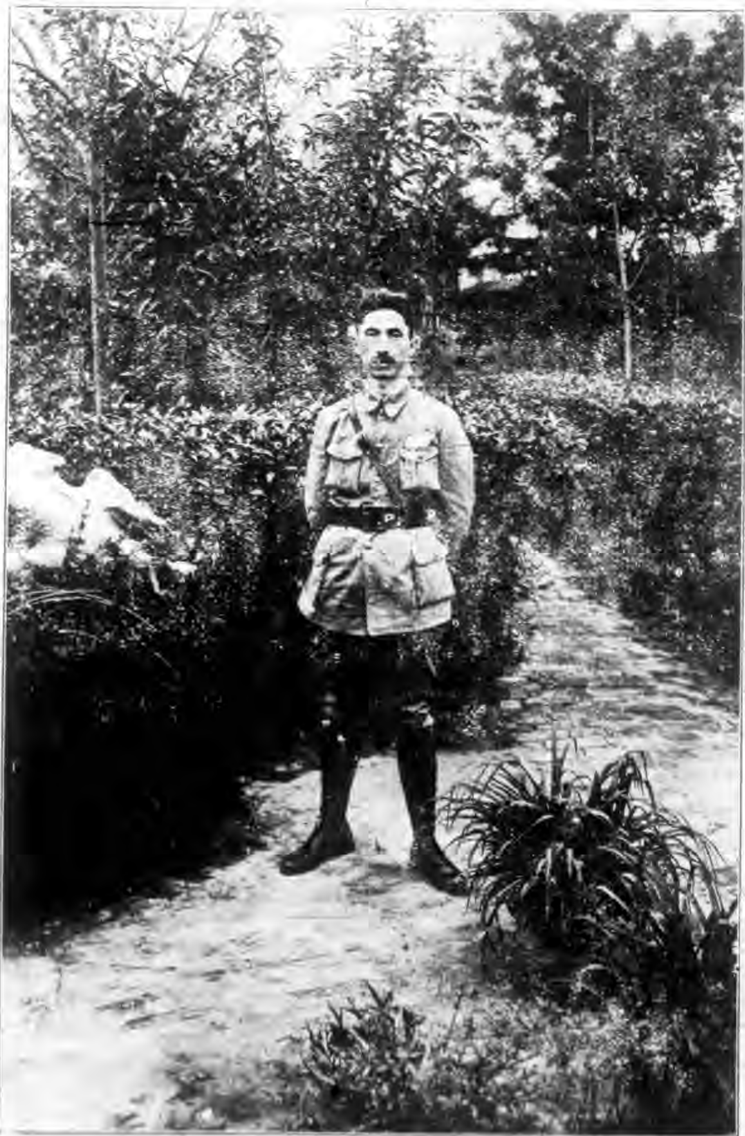
孫 天 長 局 孫