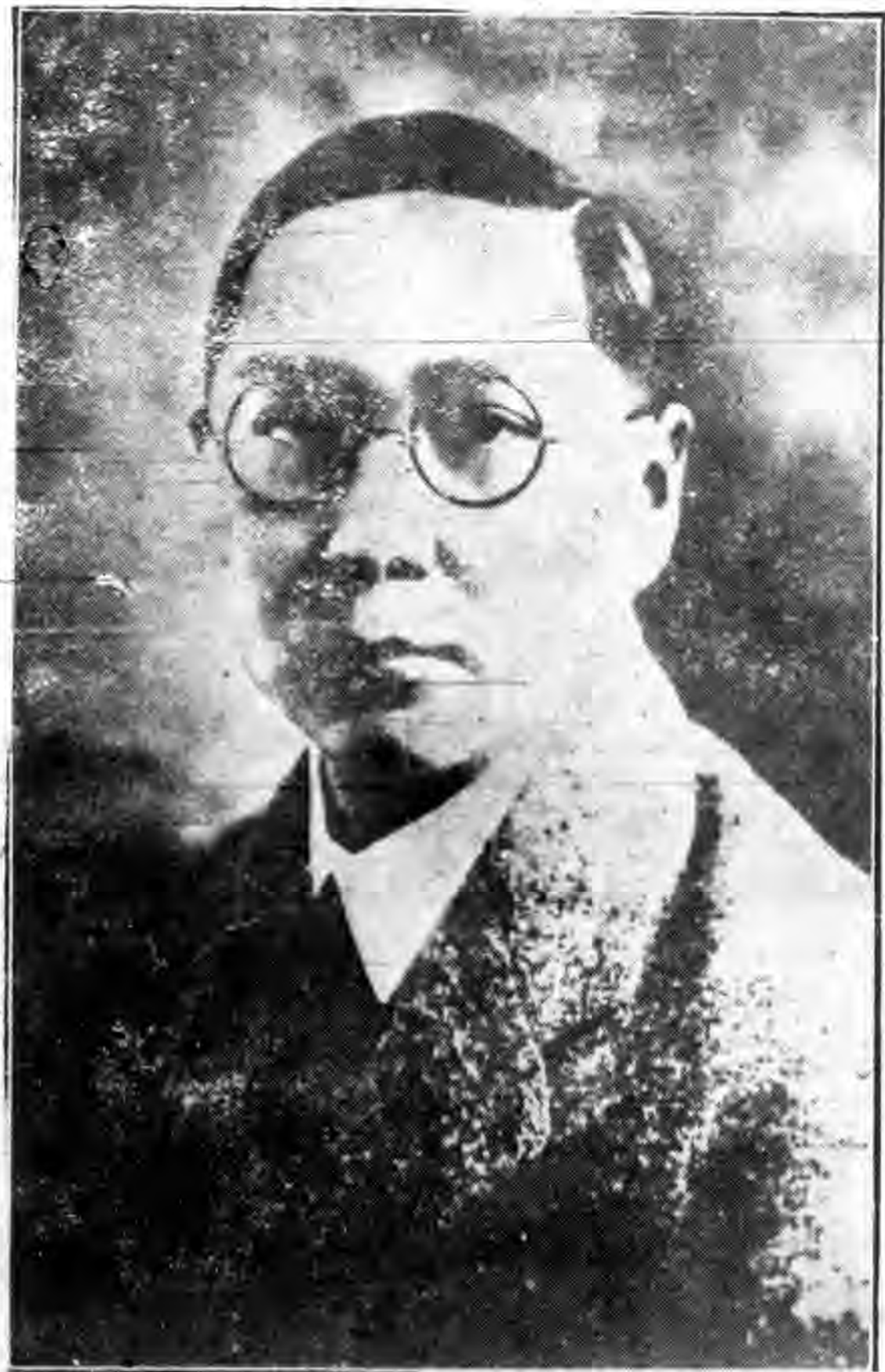
鐵道部孫部長哲生