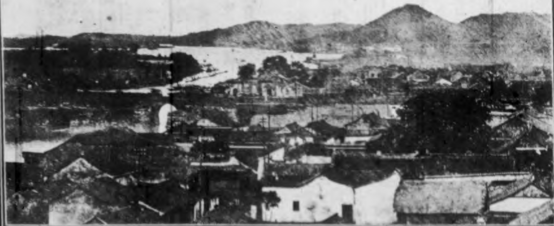
湖 州 南 門 外 風 景 (一) 峴 山