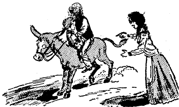
• 話說著擡抬子女青年有旁，著走驢騎子父