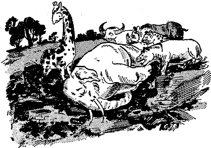
。了去死天著朝地窺僵肢四，地了著背王大象

王宮塌倒的巨響，早已驚動了所有的野獸們。牠們都來找尋這隻自高自大的象大王，想打死牠；有的想討還牠們的一隻耳朵；還有的想搶著割下象大王的大耳朵，作爲紀念品。