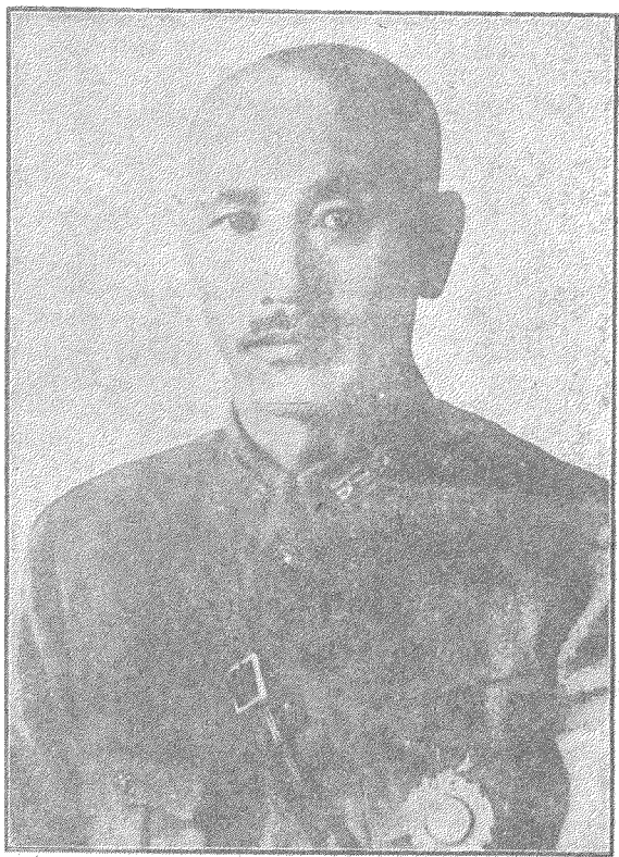
蔣 主 席 近 照