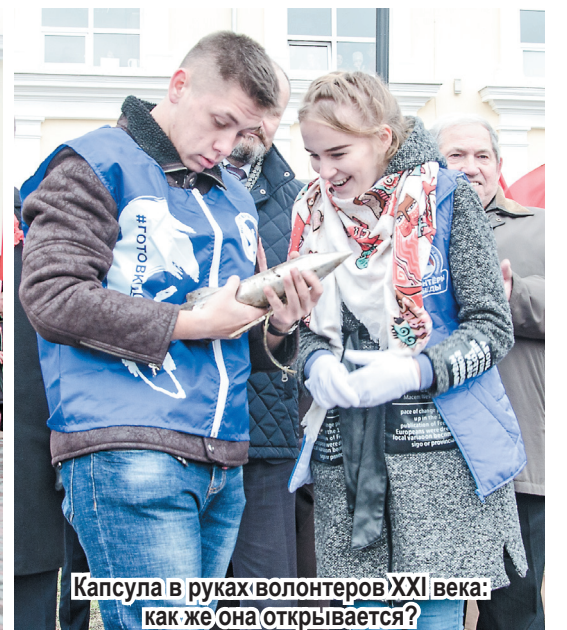
Капсула в руках волонтеров XXI века: как же она открывается?