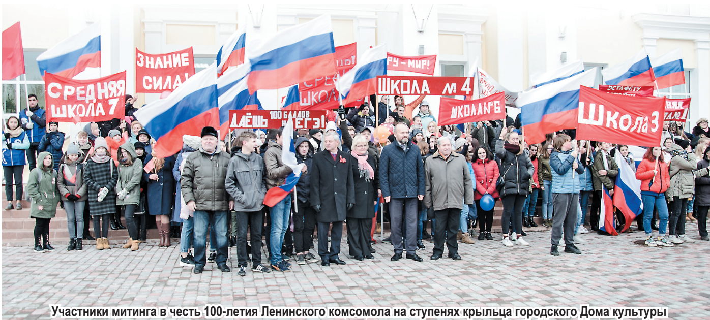
Участники митинга в честь 100-летия Ленинского комсомола на ступенях крыльца городского Дома культуры