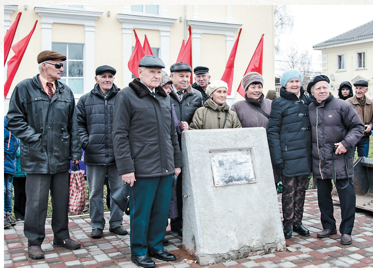
Историческое фото с памятным знаком на Народной площади, обозначающим место, где заложена так называемая «капсула времени». Уже через минуту экскаватор извлечет ее из земли и она будет представлена на всеобщее обозрение