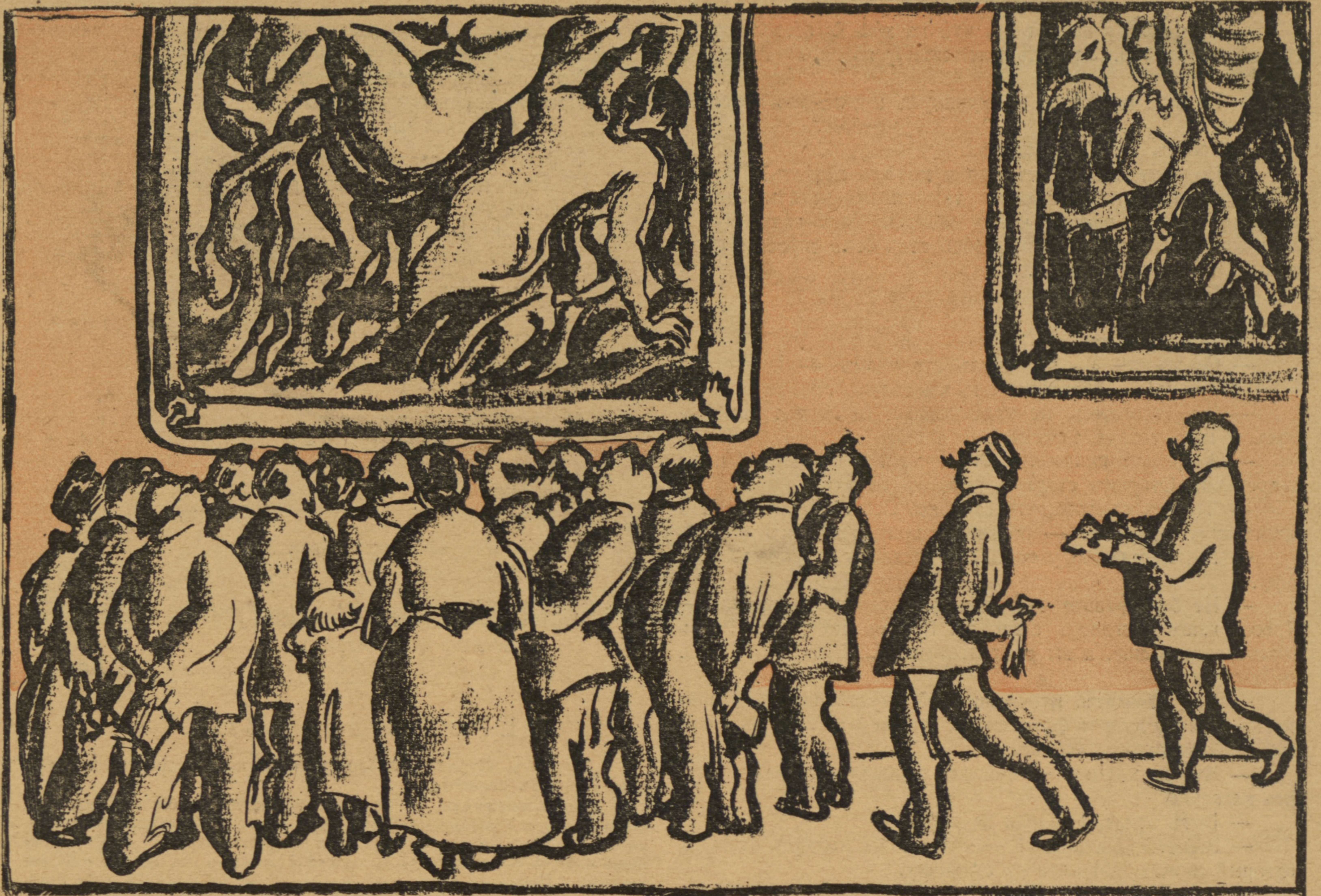
Публика въ Берлинскомъ музеѣ — до войны.