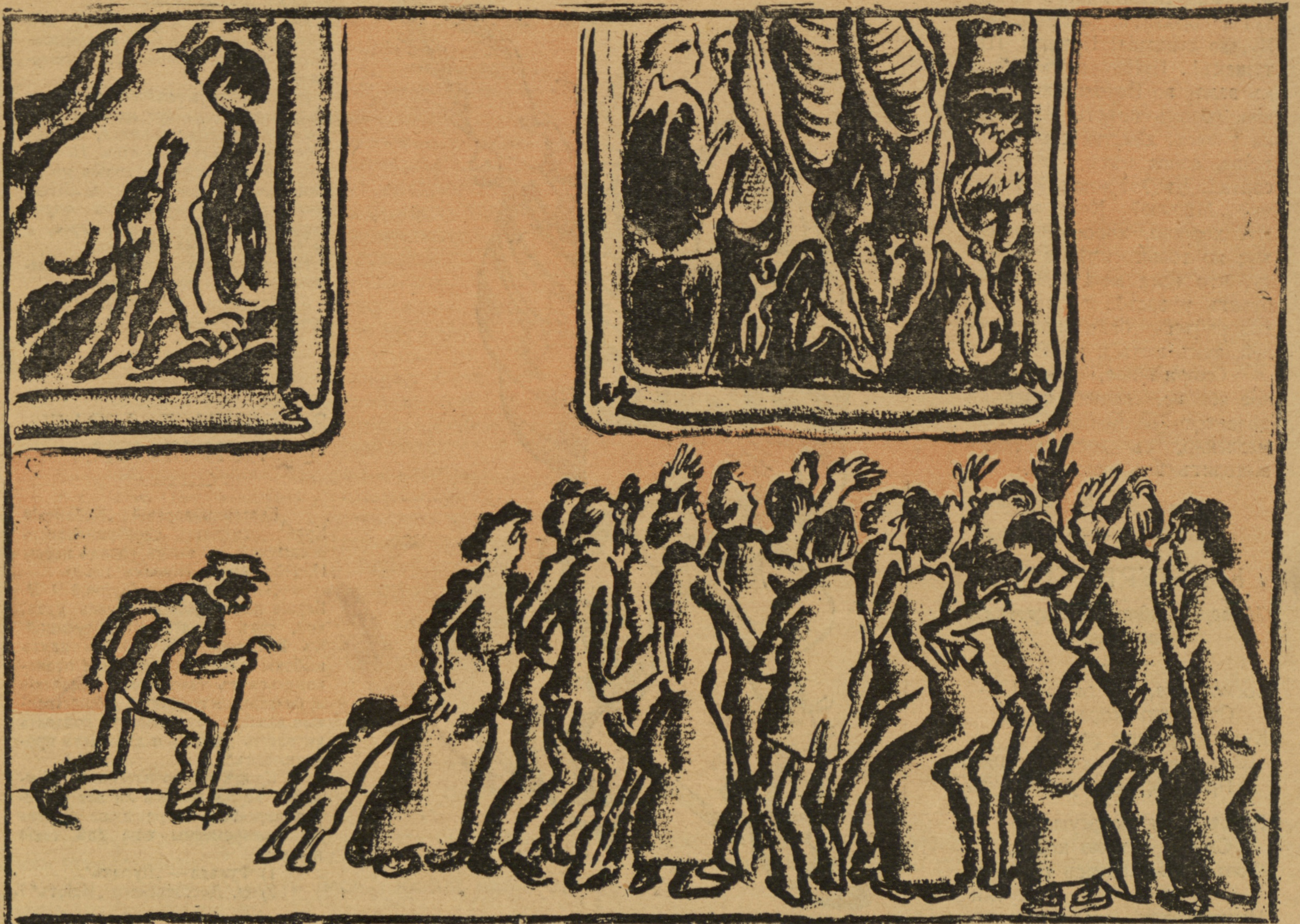
Публика въ Берлинскомъ музеѣ — теперь.