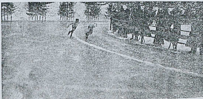
Бѣгъ на каткѣ I-го Р. Г. О. „Соколъ“.

Какъ извѣстно, Струнниковъ недѣлю назадъ побилъ въ Христианіи всемірный рекордъ въ бѣгѣ на конькахъ на 5,000 метровъ, пробѣжавъ эту дистанцію въ 8 м. 37,2 сек. Теперь