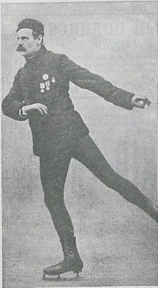
Петеръ Ріензенъ, чемпионъ Дани.