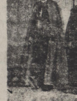
نایبند پاپ برای تحصیل اجازه مرخصی روز پنجشنبه بانایق معاون خوبی در دکان مرمر حضور شاهنشاه شرفیاب گردید.

از تاریخ هفدهم فروردین این انتصابات در ارتش صورت گرفته است: سرلشکر غلامرضا شاهین نوری رئیس اداره کارگری است بازرسی ناحیه ۲ وزارت دفاع ملی. سرلشکر بقیه در صفحه چهارم