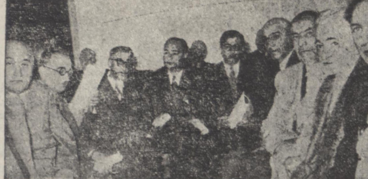
یکشنبه از آقایان بازرگانان که امروز در پیشکاری دارائی تهران حضور یافته بودند