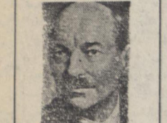
لندن - رویترز

لندن - رویترز - فرانسه - محافل نزدیک به چرچیل کارگری انگلیس در لندن اعلام کردند که گفتگویی با نخست وزیر سابق انگلیس دعوت مارشال تیتو را برای مسافرت به یوگسلاوی پذیرفته و وی هنوز تاریخ حرکت وی به یوگسلاوی تعیین نشده است.