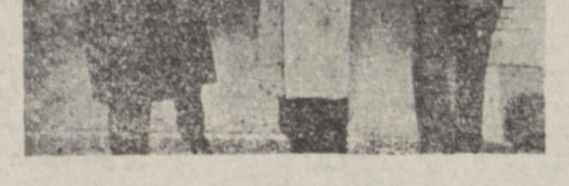
آقای هندرسن سفیر کبیر آمریکا مقارن ظهر امروز با آقای نخست وزیر ملاقات کرد. این عکس هنگام خروج وی از منزل آقای دکتر مصدق برداشته شده است. آقایان هلی پاشا صالح مستشار ایرانی سفارت امریکای فروروشی مخصوص نخست وزیر دیده میشود.

آقای وکیل آشتیانی بست سر کنسول دولت شاهنشاهی در هامبورگ تعیین شده و پسرش ایشان نیز به وزارت امور خارجه رسیده است. قرار اطلاع مقدمات حرکت آقای آشتیانی فراهم گردیده و وی به زودی بعجل ماموریت خود عزم زیت خواهد کرد.