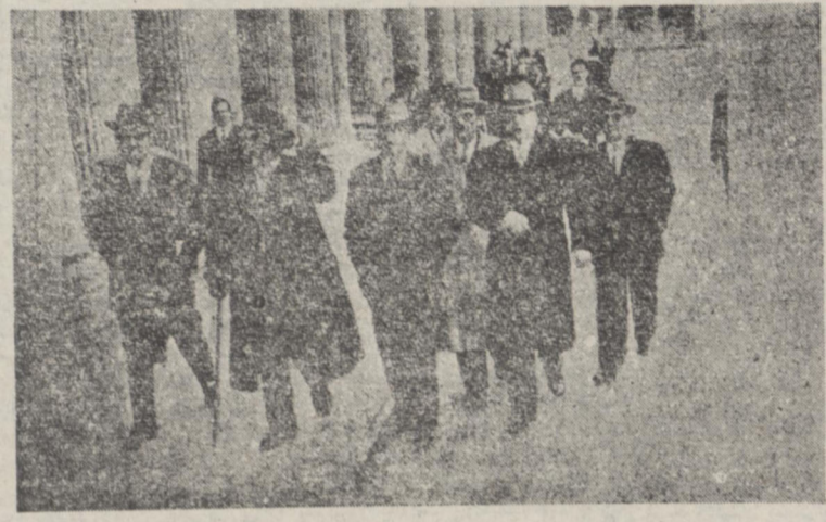
چند تن از آقایان نمایندگان منفرد مجلس که امروز از خدمت خود بلافاصله آقای نخست وزیر رفته. این عکس هنگام خروج آنان از مجلس برداشته شده است. جریان اقدامات این هیئت ضمن گزارش خبرنگار پارلمانی ما شرح شده است.