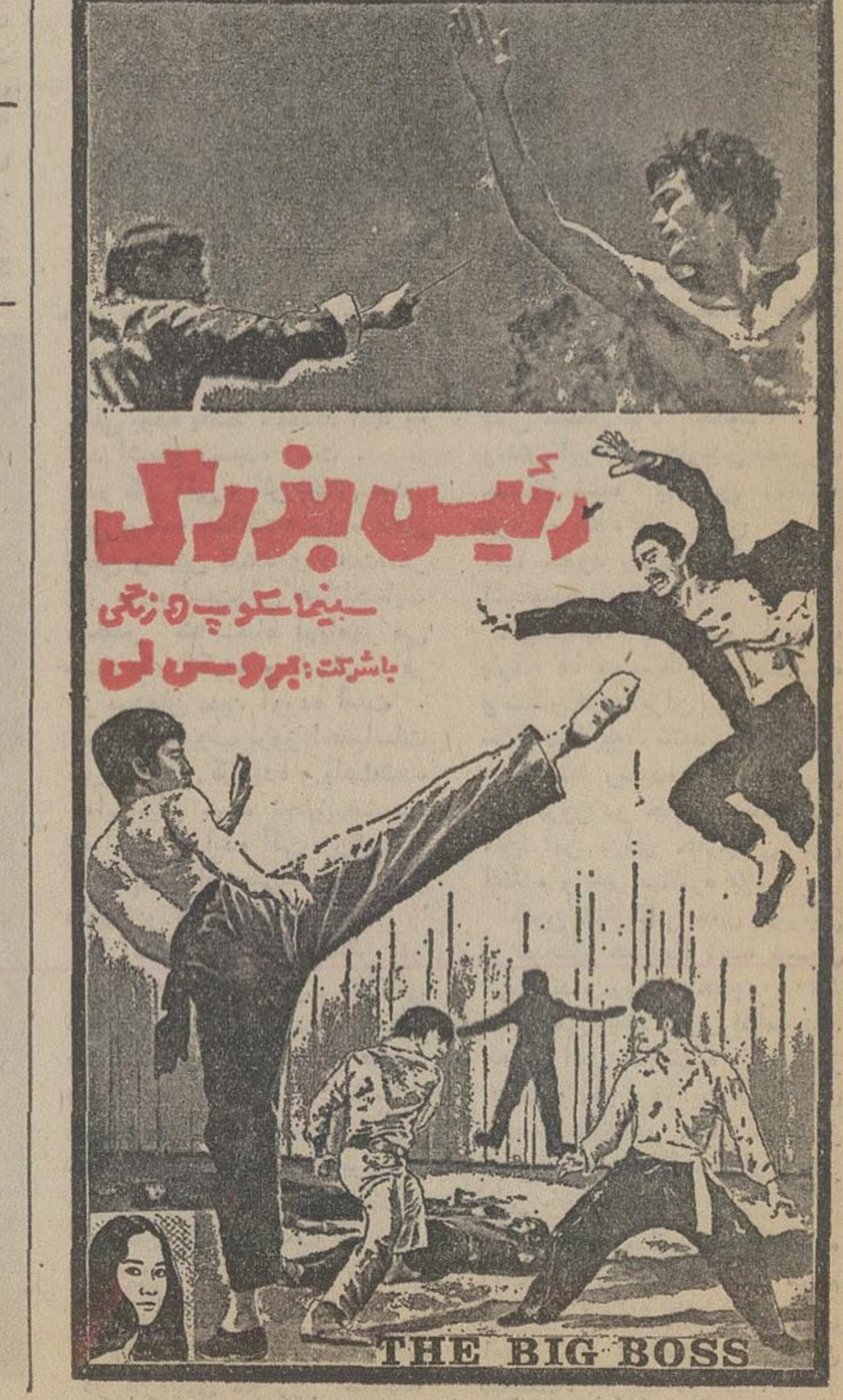
THE BIG BOSS

گرفت جریان را به پلیس خبر دهم. اما چون شماره تلفن را نداشته یک روزنامه اطلاعات خریدم و به کمک آن تلفن مرکز پلیس را پیدا کردم و جریز را اطلاع دادم. خیرعلی که شاگرد کلاس ۹ دبیرستان است، افزود: هساعتی