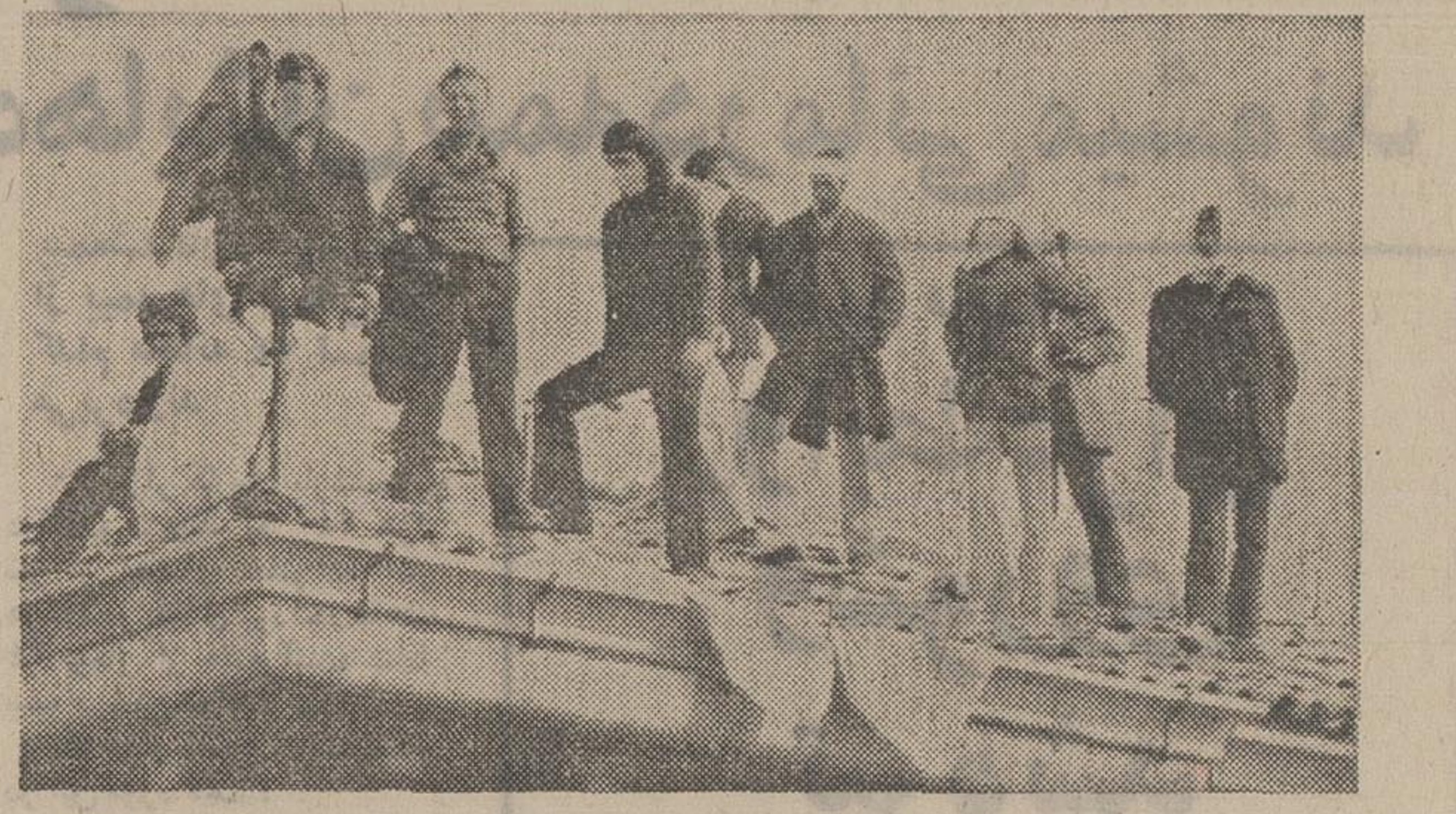
شورش زندانیان - بیش از ۲۴۰ نفر از زندانیان زندان سانتاماریا در ونیز ایتالیا دست به شورش زدند . زندانیان شورشی خواستار بهتر شدن وضع زندان هستند . در عکس عده ای از زندانیان شورشی که روی پشتبام زندان رفته اند دیده می شود .

اخطار به شرکت های نفتی سیدنی - رويتر - دولت استرالیا شرکت های بین المللی نفتی اخطار کرد که از مداخله در امور داخلی این کشور بپرهیز کنند و گرته باکس العمل شدید دولت روبرو خواهند شد . دانشان کل استرالیا در جلسه سالی این کشور گفت: چند شرکت نفتی غربی اخیرا کشور را ترک کرده اند در امور داخلی استرالیا مداخله کنند .