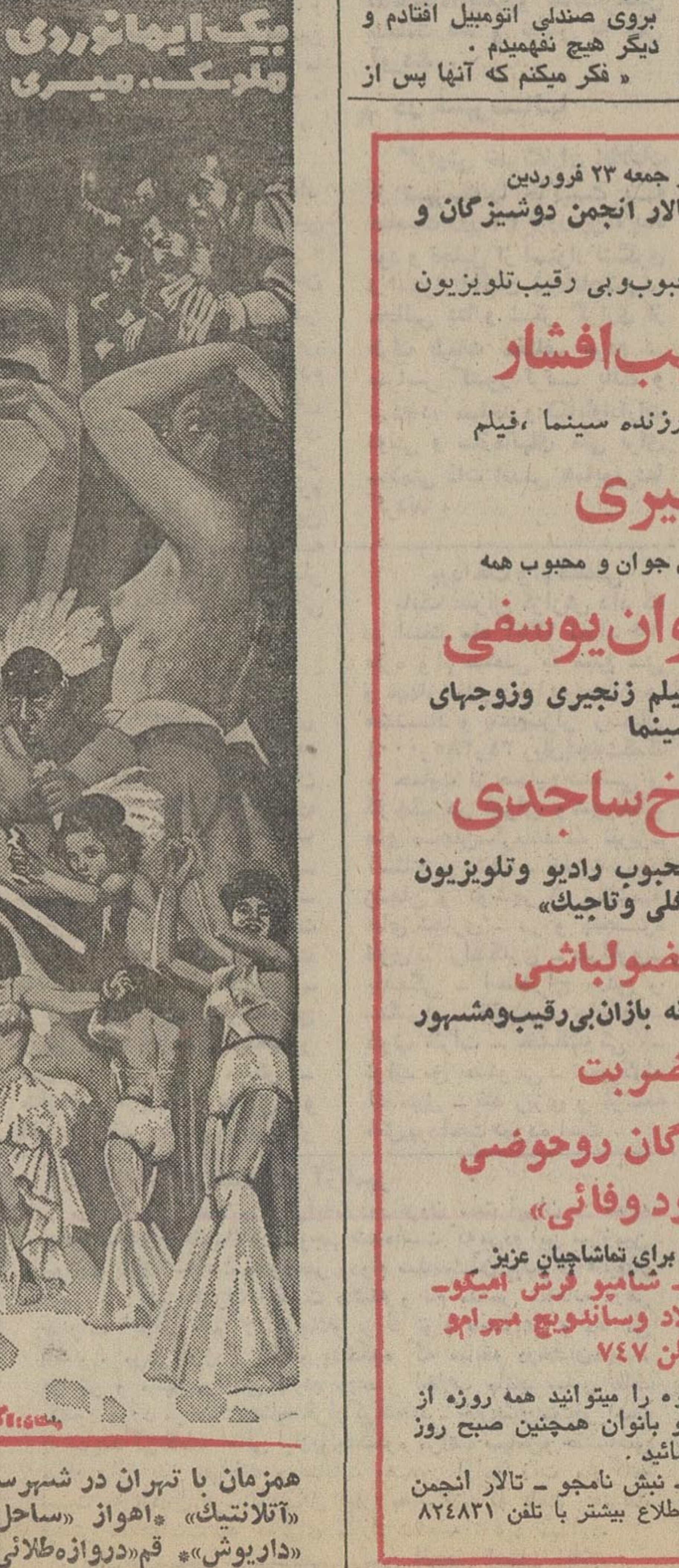
همزمان با تهران در شهرستانهای شمشیر، شمر فرنگ - فردوسی - هما، کرمانشاه «آلاتنتک» - اهواز «ساحل» - آبادان «شیرین» - رشت «آسیا» - تبریز «آریا» - بابل «داریوش» - قم «دروازه طلانی» - شیراز «کاپری» - پرمپولیس، بندرپهلوی «گل سرخ»