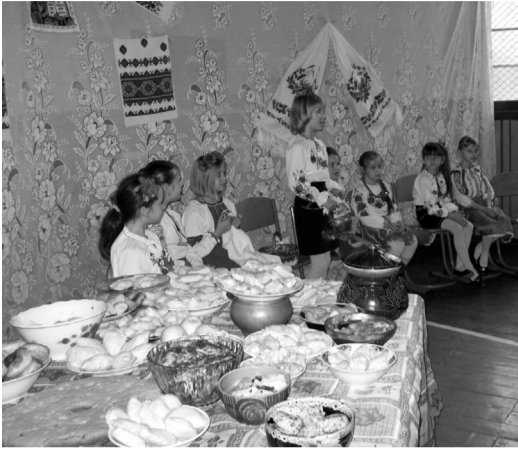
З усіх свят річного календарного циклу день Андрія Первозванного є одним

з найтаємничіших, найвеселіших та найочікуваних.