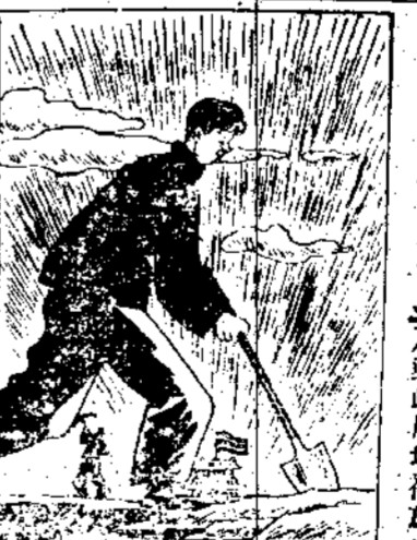
我們需要革新生活安定民生

【東京中華社電】據德新新聞社羅馬電：印度孟買某車站，發生暴動事件，運兵列車二輛被炸出軌，死傷數百人。據德新新聞社羅馬電：印度孟買某車站，發生暴動事件，運兵列車二輛被炸出軌，死傷數百人。