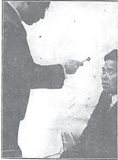
深 麻 醉 法