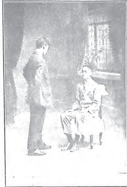
前立術勿懼勿息閉彼(一) 一亦於者聽勿疑靜日術(二) 精自統其乃施思勿坐屏者(三) 神己(四)