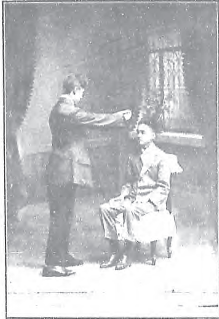
掌略被之相(一) 二和三距額前(二) 輕或加於(三) 微額如(四) 感弱電(五) 狀(六)