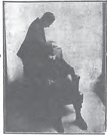
為開始施術。 （參閱本講義第二期 第二十一章）