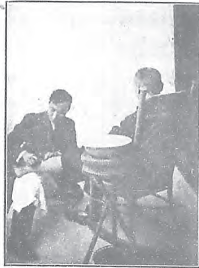
患脚氣症者之治療