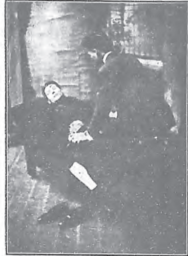
應 用 呼 吸 法