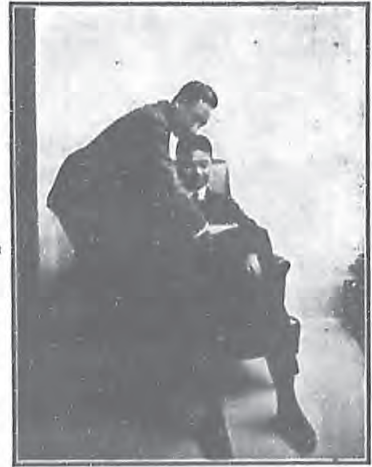
為羅術後之撫摩。 （參閱本講義第 二期第八章乙戊）