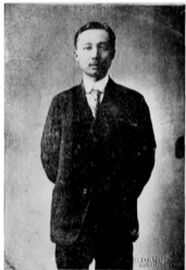
生先生靜龍長事堂