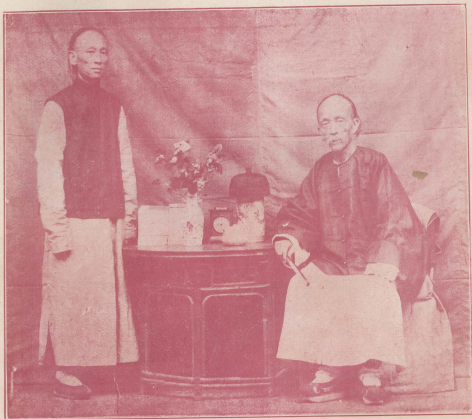
像遺庵笠姪其及主館經畚