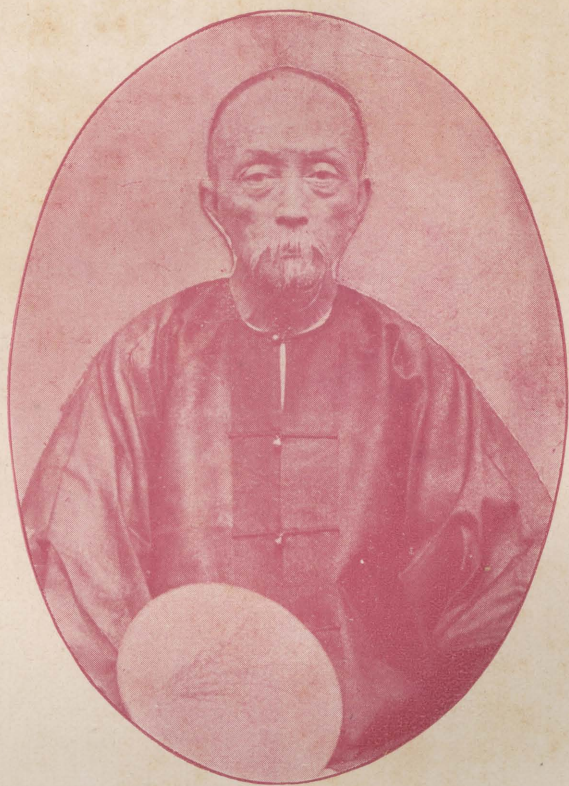
像 遺 主 館 經 畚