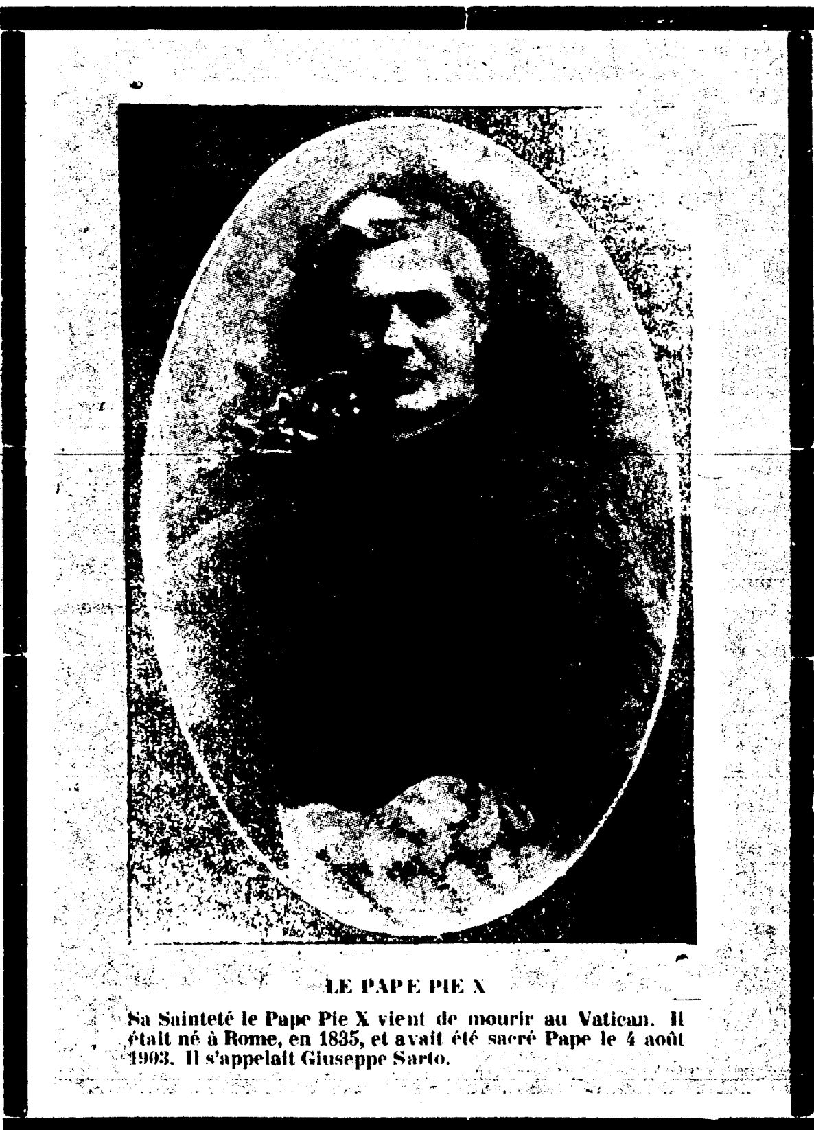
LE PAPE PIE X Sa Sainteté le Pape Pie X vient de mourir au Vatican. Il était né à Rome, en 1835, et avait été sacré Pape le 4 août 1903. Il s'appelait Giuseppe Sarto.