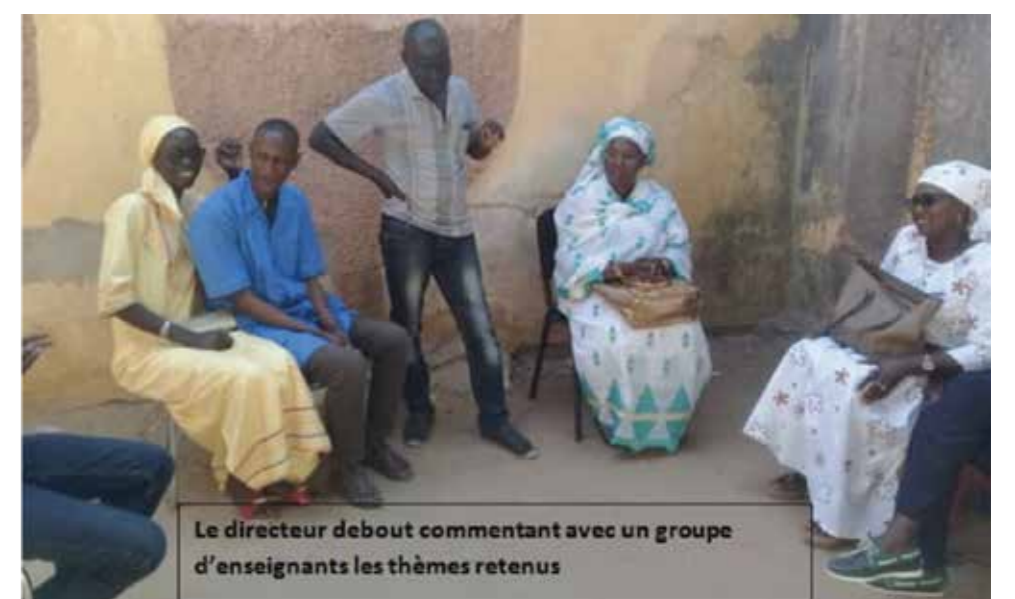
Le directeur de l'Ecole SEIB de Diourbel au Sénégal échange avec ses collègues sur les thèmes à traiter lors du Wikichallenge. Les articles écrits seront publiés dans Vikidia, l'encyclopédie en ligne des 8-13 ans que tout le monde peut améliorer. Le cliché est pris par Tafsir, le médiateur numérique du Sénégal.