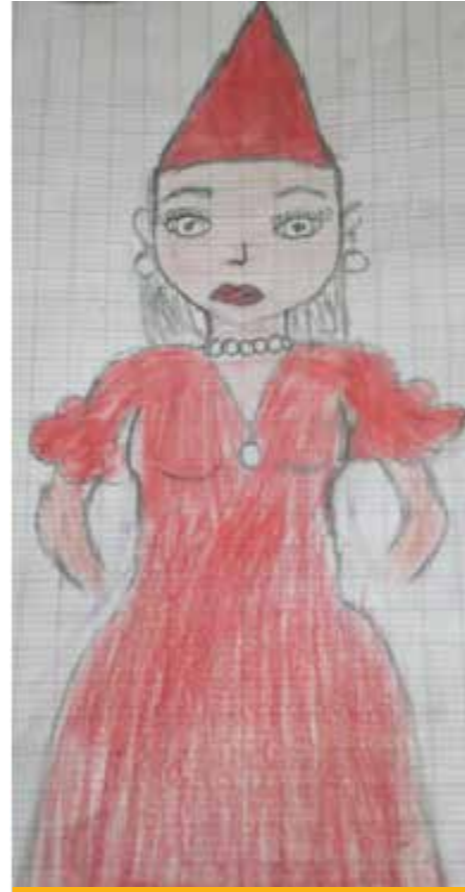
Les enfants illustrent parfois leur article par des dessins. Ici, une signare, dessin fait par les élèves de l'école Mariama Bâ, pour illustrer l'article portant sur Gorée et les captivités d'esclave.