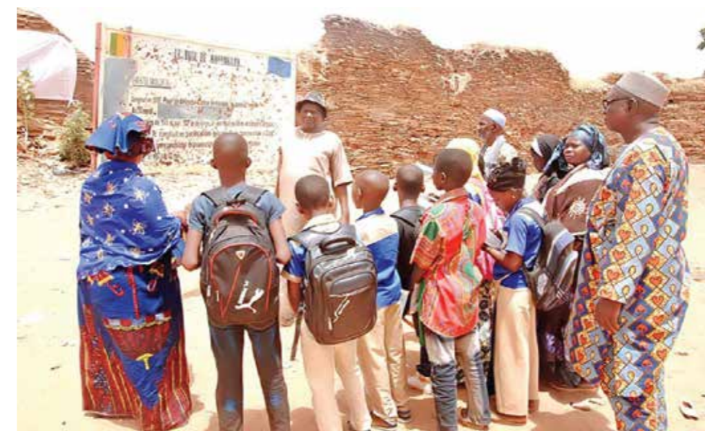
Dans la plupart des établissements, la participation au concours s'inscrit dans le projet pédagogique. Pour certains, cela se manifeste par des visites de musées, de point d'intérêt, dans d'autres cas les élèves peuvent être amenés à réaliser des interviews de personnes notables, ou participer à des ateliers (de cuisine, de dessin...).