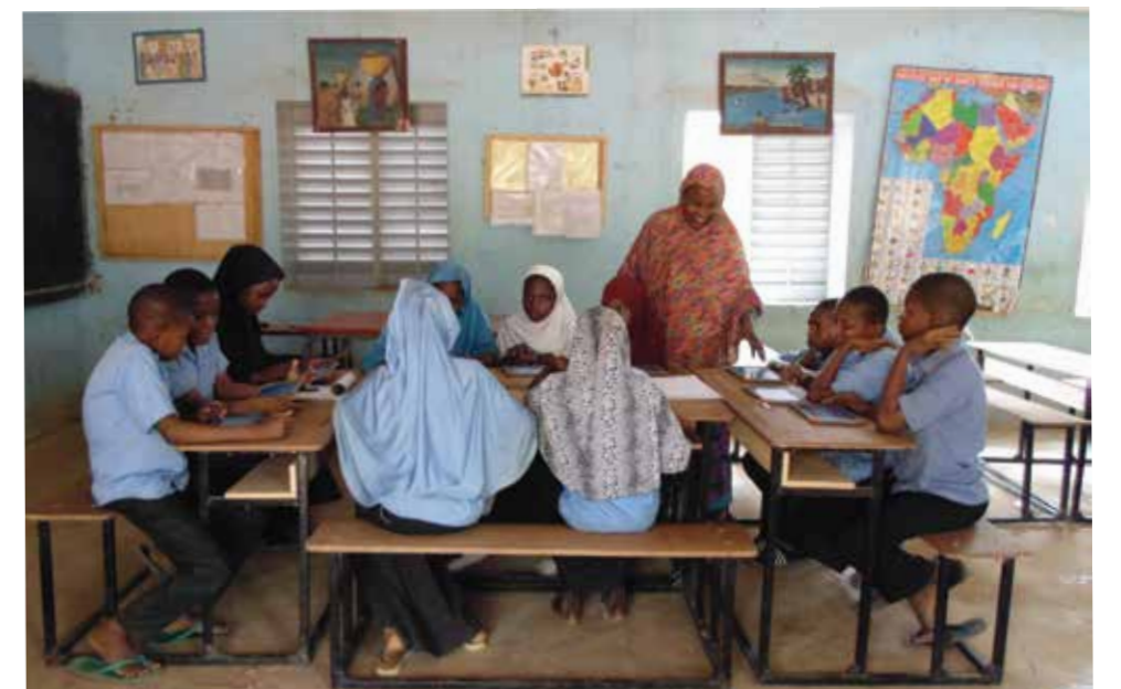
Les enfants de l'école Poudrière au Niger, pris en photo par Amadoubrahim, le médiateur Niger, sont en pleine séance de travail avec leur enseignante. Les élèves ont remporté un bien mérité prix national pour leur article sur la lutte traditionnelle.