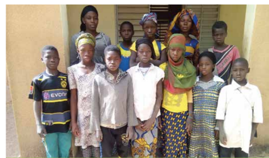
Les élèves de Kimparana posent devant l'objectif de Nfana, le médiateur numérique du Mali. Les établissements sont accompagnés dans chaque pays par un médiateur numérique dédié pour aider à la compréhension du concours, aux choix des thèmes d'écriture, à la mise en oeuvre opérationnelle avec les enfants, à la formation du personnel enseignant et... à la récupération des contenus produits !