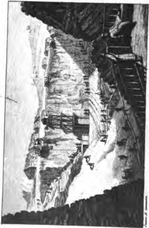
Разработка каменного угля в Усть-Зырянск.