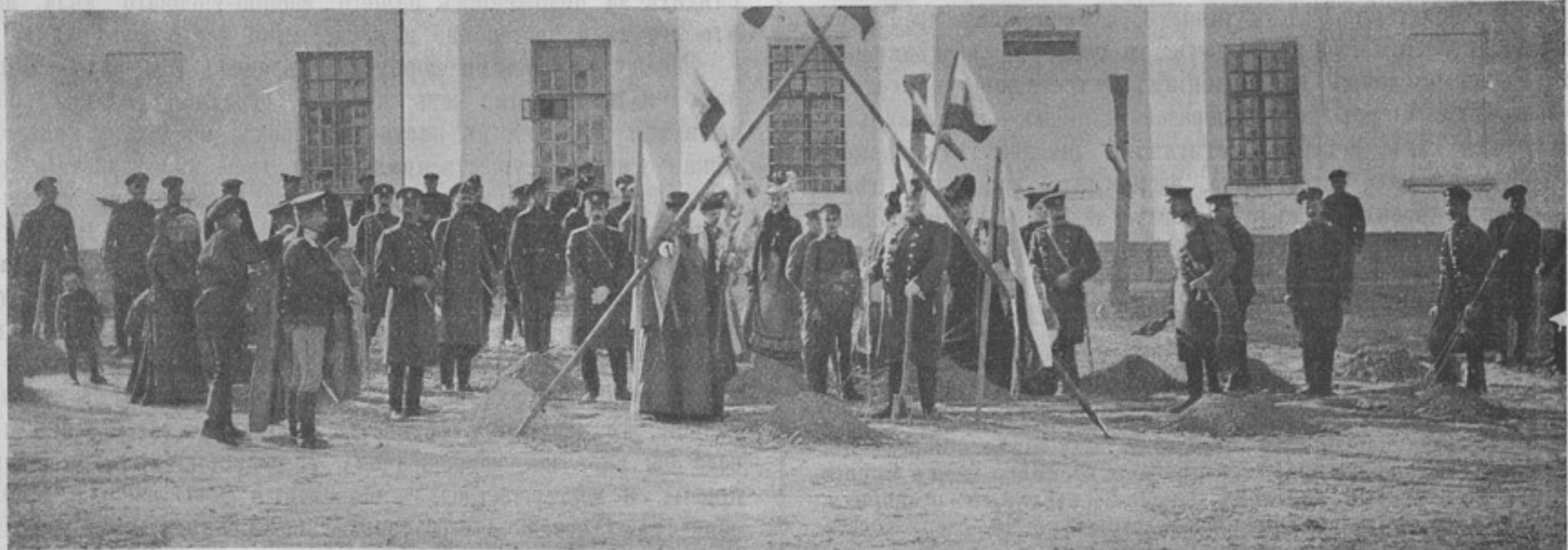
Къ корресп. «Н. Маргеланъ».