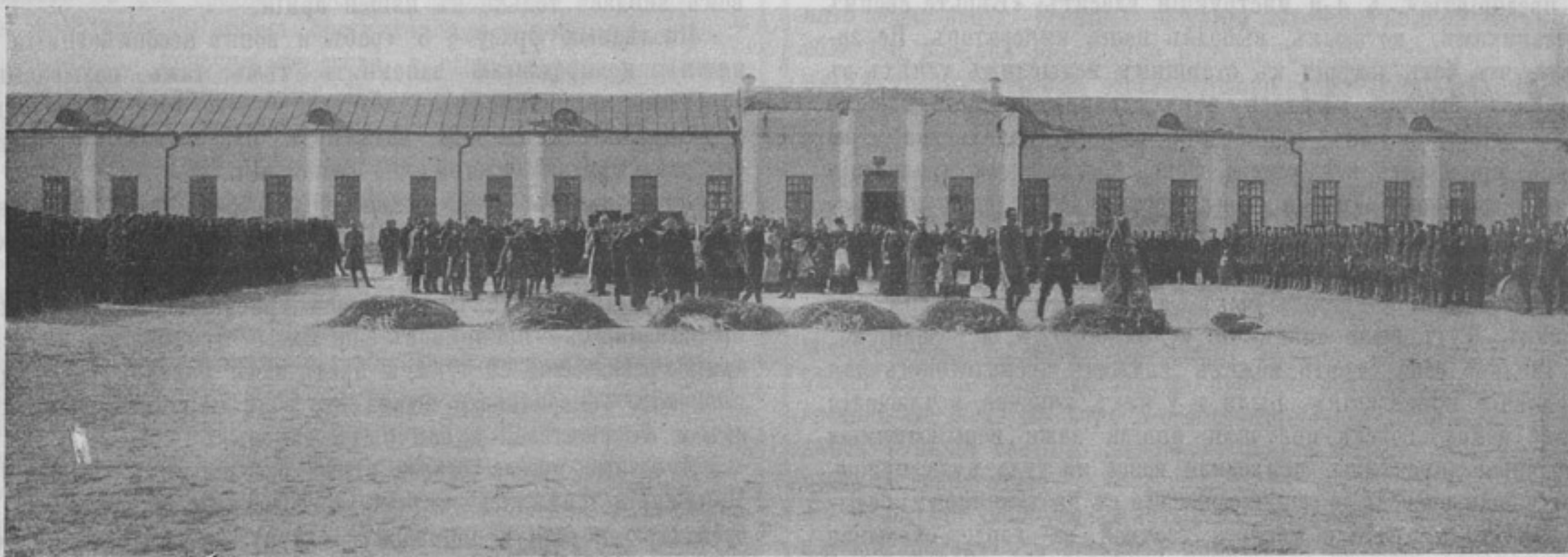
Къ корресп. «Н. Маргеланъ».

Я предвижу нападки, предвижу дикія обвиненія меня, чуть ли, не въ посрамленіи дорогой для всѣхъ насъ русской арміи и потому заранѣе говорю, что какъ матеріалъ для войны