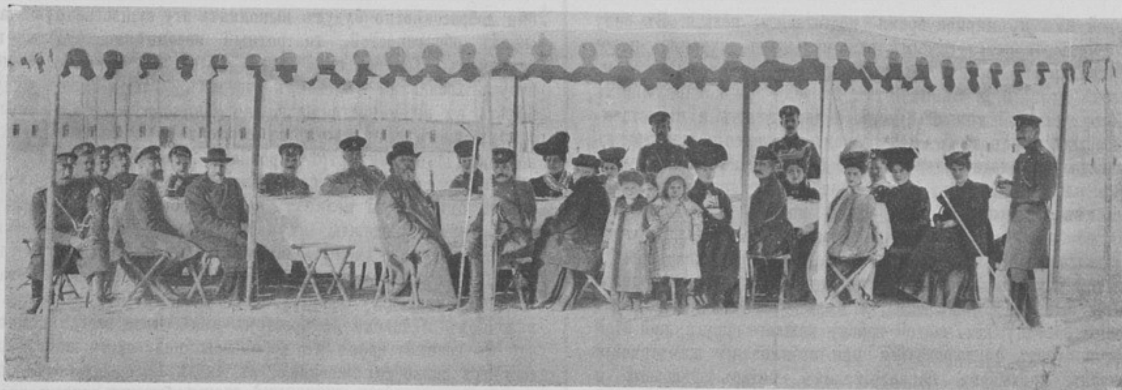
Къ корресп. «Н. Маргеланъ».

дневальныхъ, дозорныхъ, лагернаго коменданта или полицеймейстера и нижнихъ чиновъ лагерной полици. Само собою разумѣется, что ни въ одномъ полку не будутъ прибѣгать къ компетенціи жандарма, чтобы судить, хорошее ли поставлено подрядчикомъ мясо или нѣтъ, какъ не станутъ дожидаться и указаній того же жандарма относительно правильности вѣсовъ у торговцевъ, или времени для засыпки отхожихъ мѣсть. Въ настоящее время усовершенствованіе лагерей въ смыслъ благоустроенности, почти полное уничтоженіе частной торговли въ нихъ и болѣе строгая и систематичная организациа внутренней службы въ войскахъ исключаютъ всякую необходимость пользоваться въ лагеряхъ специальными услугами жандармовъ, являющихся къ тому же по своему развитію не болѣе, какъ простыми кавалерійскими унтеръ-офицерами.