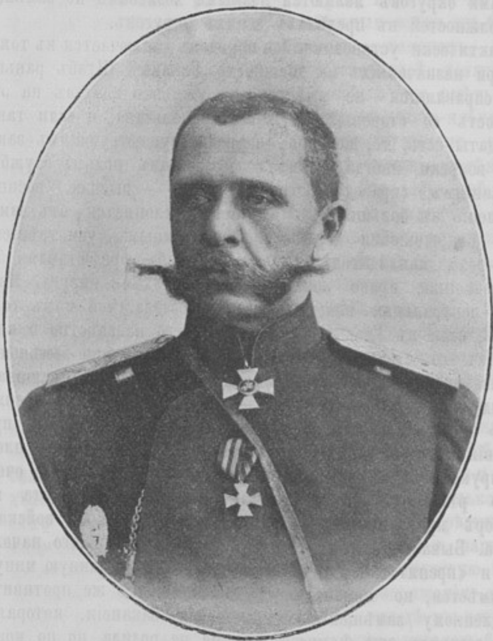
Командиръ 3-го армейскаго корпуса, генераль-лейтенантъ