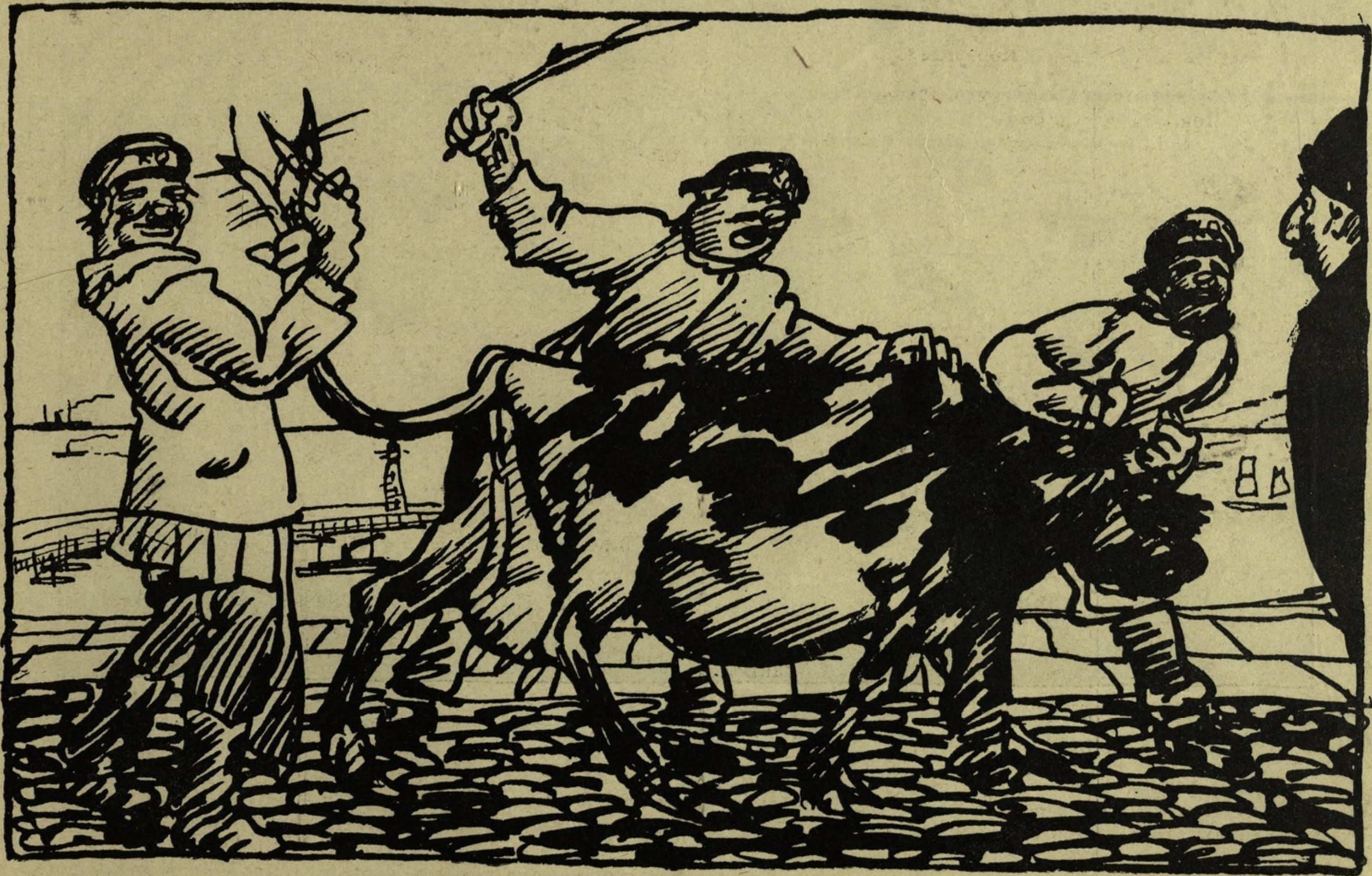
Рис. А. Яковлева.