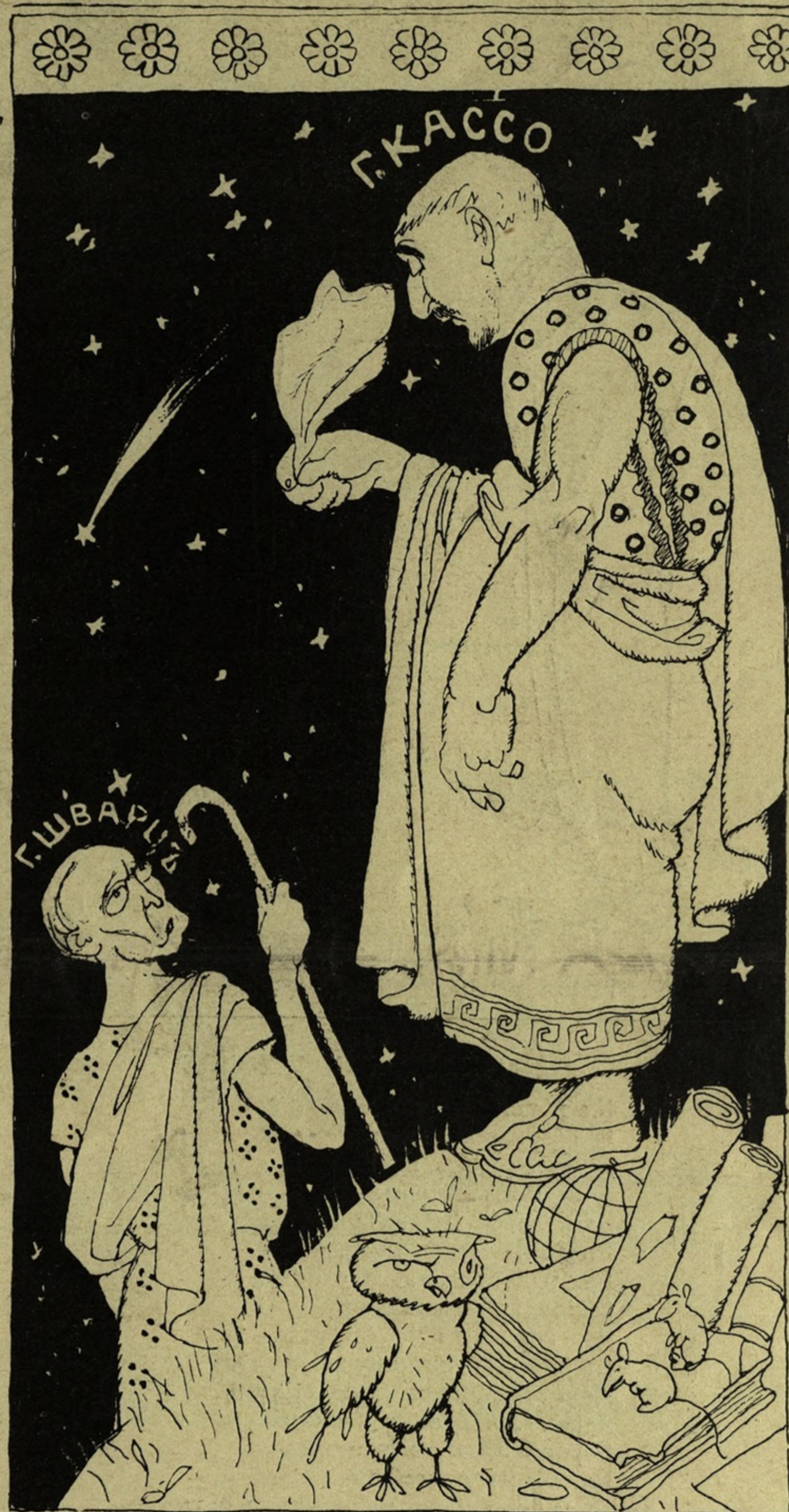
Рис. Иванова 13582.

Тамъ, гдѣ Аѳина живетъ, тамъ гдѣ мудрость всегда обитаетъ — Новый избранникъ стоитъ, и платкомъ помавая, Грустно бесѣду ведетъ самъ съ собою — О, Боги! Что за наслѣдство оставилъ мнѣ Шварцъ многодумный! Кучи уставовъ, въ которыхъ мнѣ ясенъ лишь почеркъ! Средняя школа хирѣетъ, а высшая...? Боги! Дектеріады и тѣ поведеньемъ гораздо скромнѣе. Свѣточи Феба погасли — остались одни лишь огарки. Ахъ, я боюсь, что Харонъ скоро скажетъ — бастую! Или повысьте мнѣ плату! — а гдѣ въ министерствѣ взять денегъ?