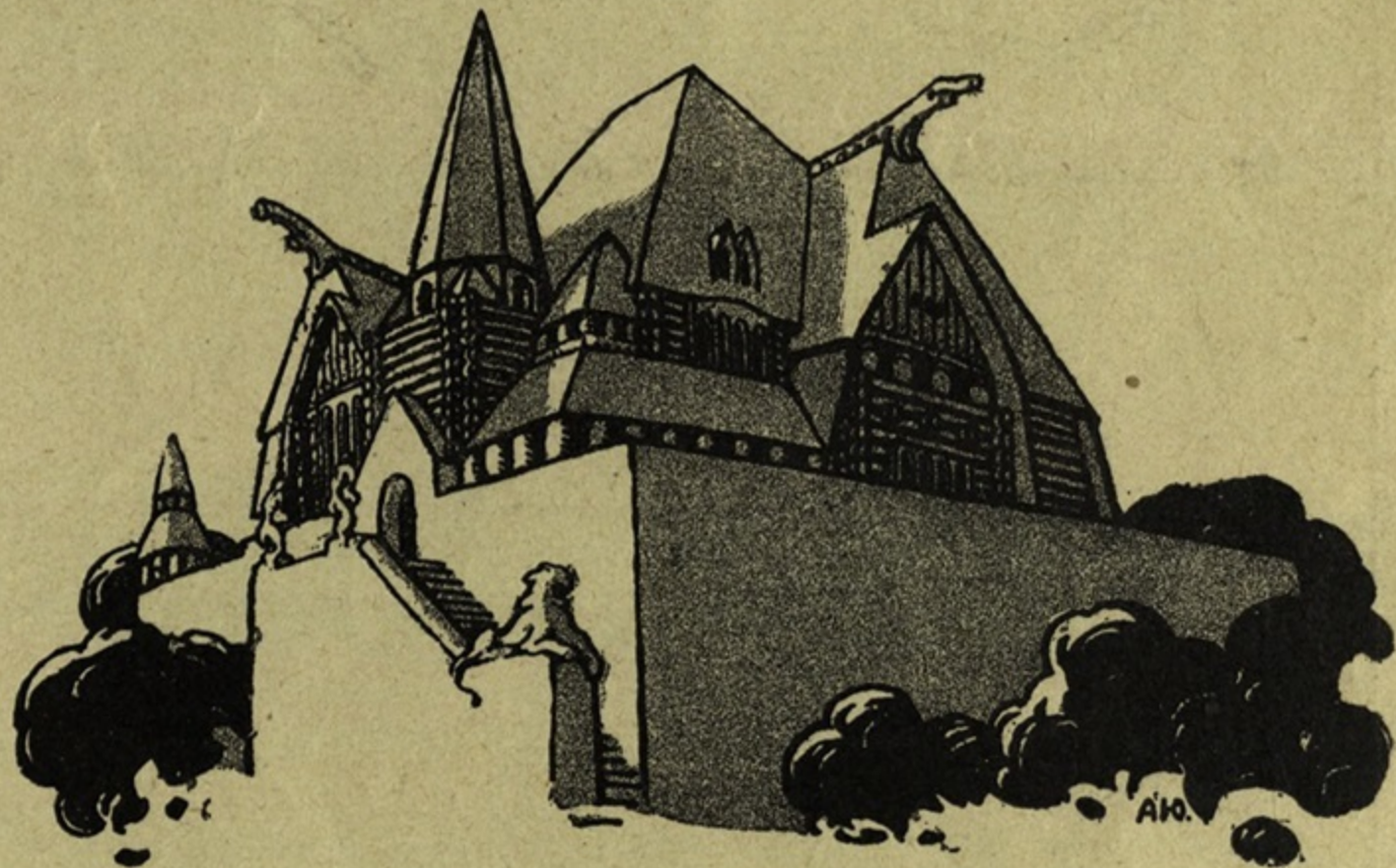
Рис. А. Юнѣра.