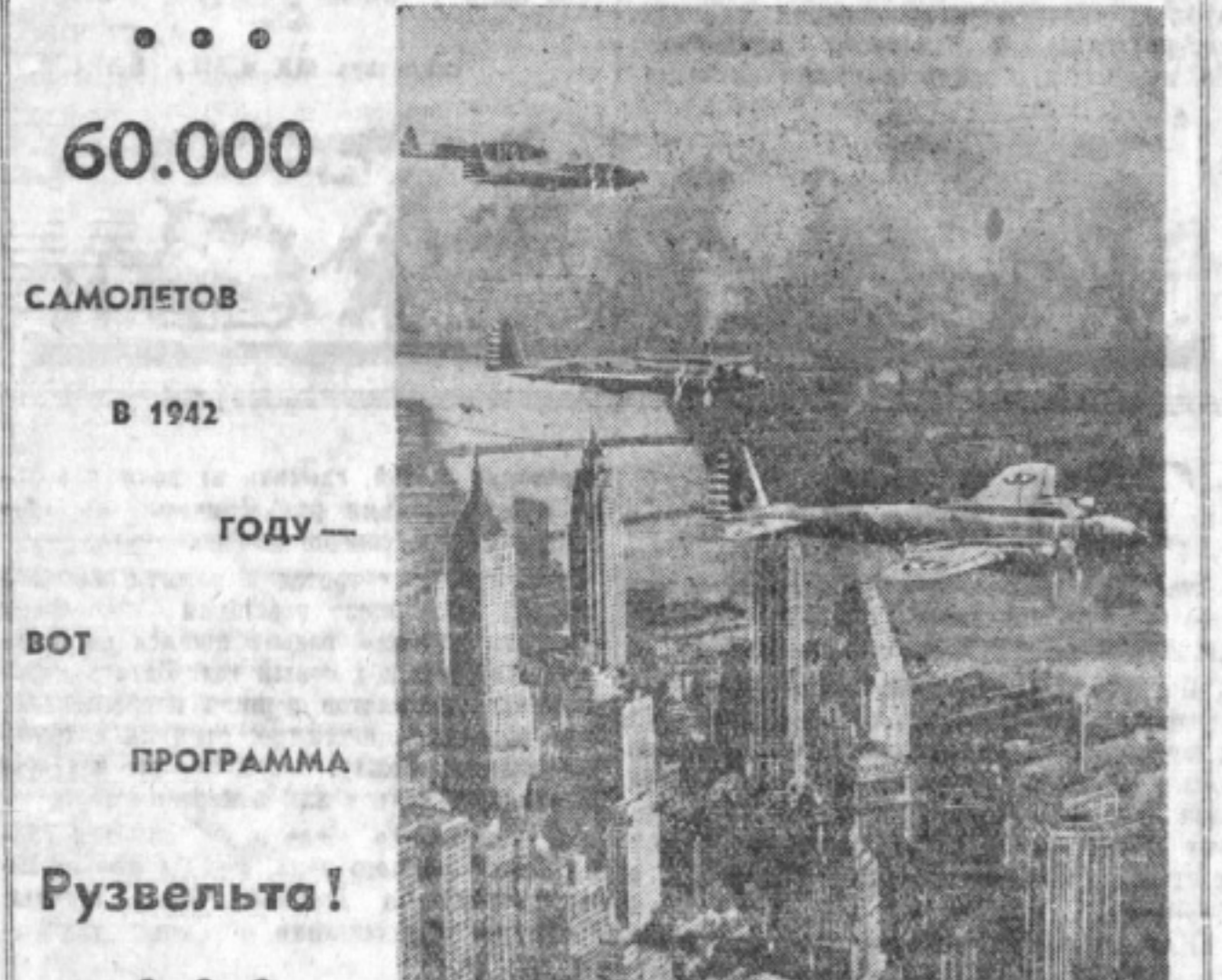
«Летающие крепости» над Нью-Йорком.

Американские тяжелые бомбардировщики типа Боинг-17 и последние конструкции известны под названием «Летающие крепости». Это мощные бомбардировщики с большим радиусом действия, сильной пушечно-пулеметной оборужением, крепкой броней, с высоким потолком и значительными скоростями.