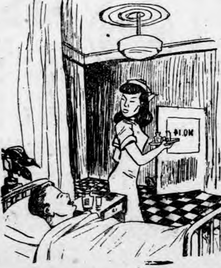
他剛要說要娶她的話，忽然開了門，進來一個人。

「夜裏我不要，夜裏給我睡整夜覺。」 「好！回頭就中。你睡整夜覺。」 「再手！回頭就中。你睡整夜覺。」 「再手！回頭就中。你睡整夜覺。」